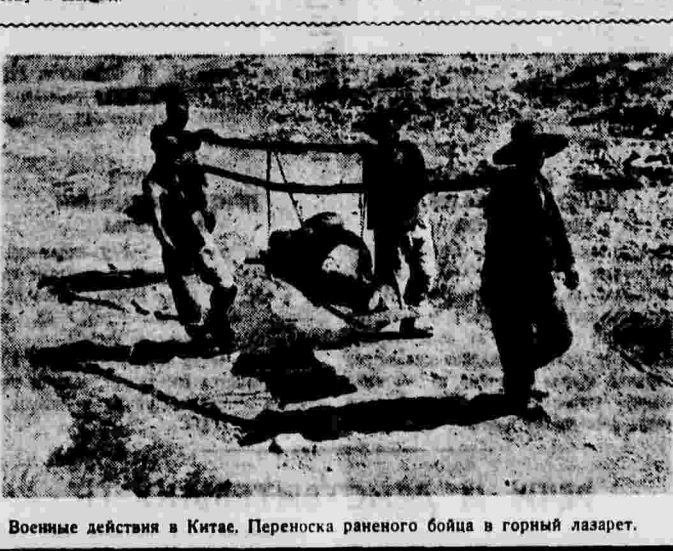
Военные действия в Китае. Переноска раненого бойца в горный лазарет.

Собрано 20 тысяч швейцарских франков и, кроме того, 8 тысяч швейцарских франков в 60 тысяч франков и 60 тыс. предметов одежды стоимостью в 81 тысячу франков. Все собранное было отправлено в Барселону и Мадрид.