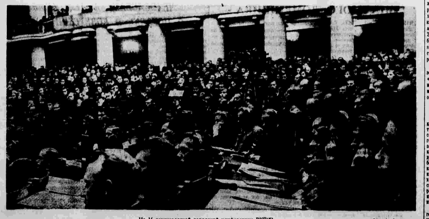
На V ленинградской городской конференции ВКП(б).

С отчетным докладом о работе оргбюро ЦК КП(б)У по Могилевской области выступил исполняющий обязанности первого секретаря оргбюро тов. Ренинский.