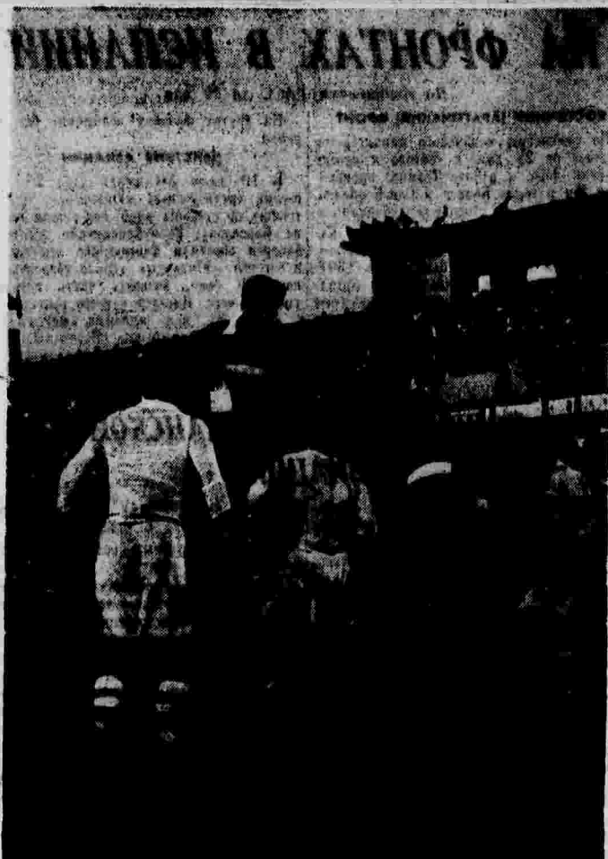
Футбольный матч между командами «Спартак» (Москва) и «Динамо» (Киев) на стадионе «Динамо» в Москве.

КНЕВ, 29 мая. (Морр. «Правда»). Летом этого года 500 студентов Киевского промышленного института получат путевки в дома отдыха, 100 человек поедут в санатории Крыма, Украины и Кавказа. Кроме того, 100 студентов отправятся в дальние экскурсии, а 60 — в высокогорные альпинистские лагеря.