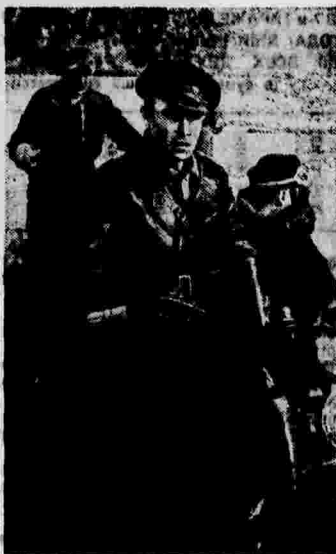
Моточиклисты службы связи республиканской армии в Испании.

ПРИЖ, 21 мая. (ТАСС). Как сообщает агентство Сепанья, германский инструктор летного дела и его ученик-испанец, слушатель германской авиационной школы в Кеерс (Испанское Марокко), были убиты в результате взрыва самолета во время учебного полета. В связи с этой катастрофой власти мятежников арестовали несколько механиков аэродрома по подозрению в саботаже.