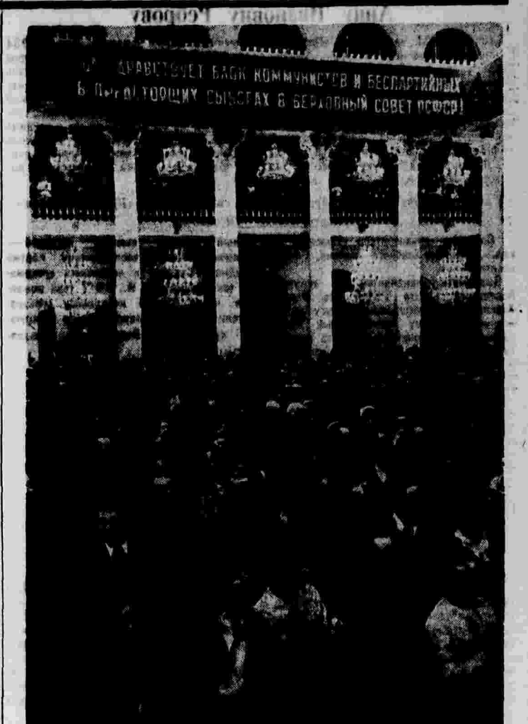
Окружное предвыборное совещание Кировского избирательного округа...