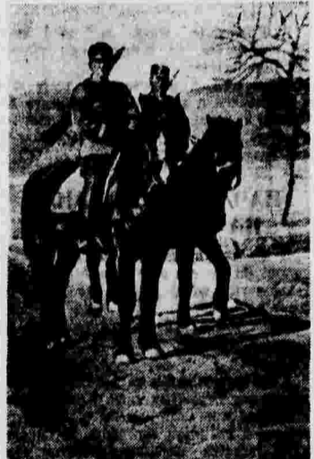
Разведчики 8-й китайской армии, вооруженные винтовками, отпачками у японских солдат.

ЛОНДОН, 20 мая. (ТАСС). По сообщению агентства Рейтер, заседание Комитета по немцам-коллаборационистам намечено на 26 мая.