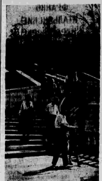
В Центральном парке культуры и отдыха имени Горького (Москва). Фото С. Коршунова.