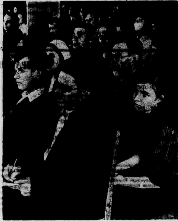
На совещании доверенных Сталинского избирательного округа гор. Москвы.