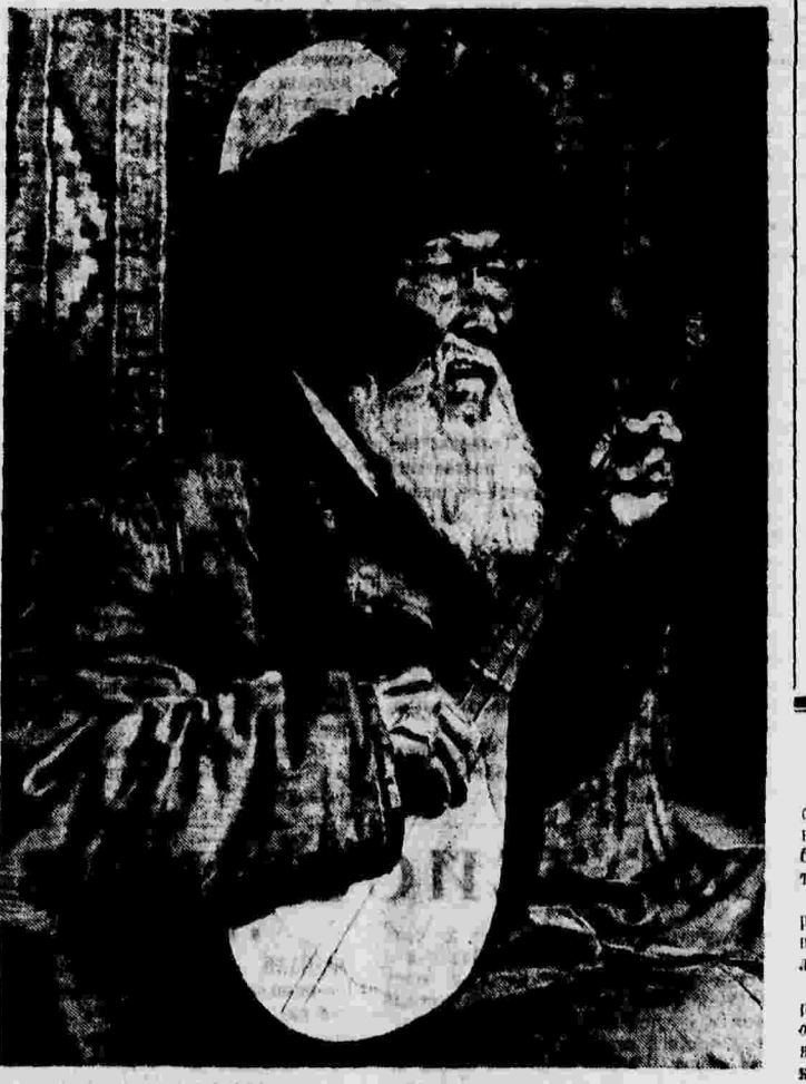
Народный певец Казахстана Джамбул.