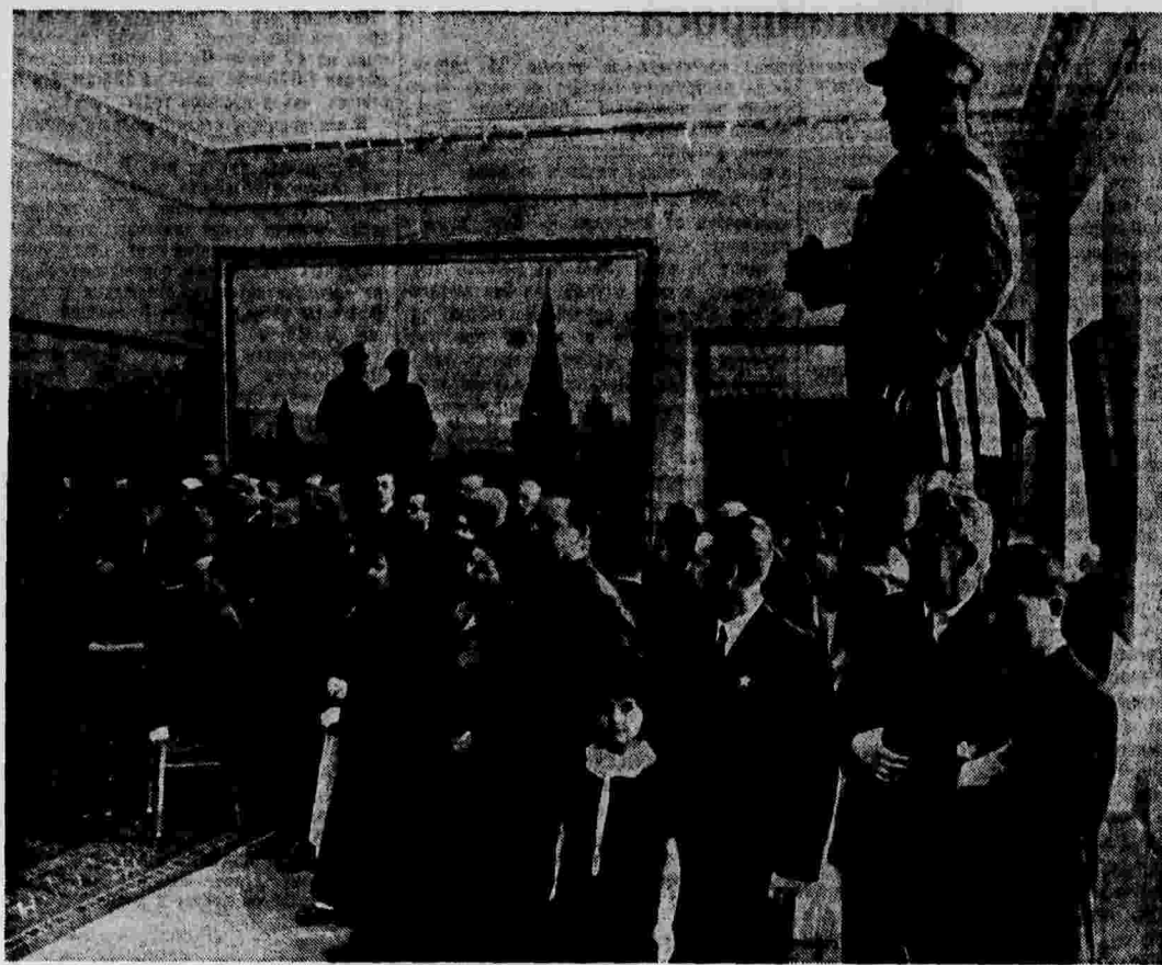
Вчера в Москве открылась художественная выставка «XX лет РККА и Военно-Морского Флота». На снимке: посетители в одном из залов выставки.