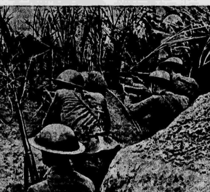
Военные действия в Китае. На снимке: бойцы китайской армии в окопах. (Созифото).

Для хранения жидкого горючего строятся бетонные резервуары с применением негорючего цемента, приобретенного французским учением Карле. До сих пор такие резервуары требовали дорогостоящей внутренней облицовки, не допускающей утечки жидкого горючего. (ТАСС).