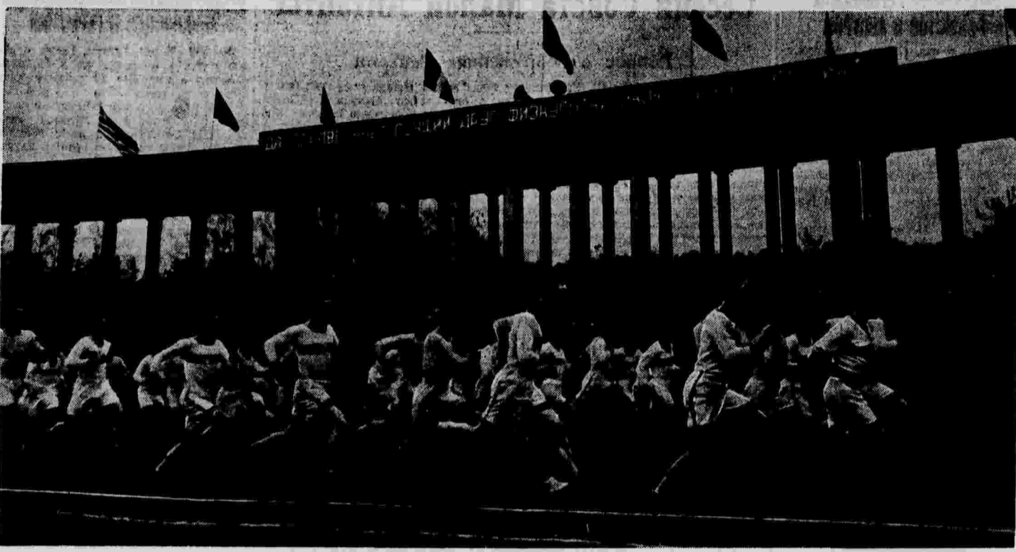
Спортивный праздник на стадионе «Сталинец» в Москве. На снимке — массовый кросс.

5 мая на железных дорогах Союза погружено 91.667 вагонов — 104,2 проц. плана, извезено 88,73 вагонов — 99,3 проц. плана.