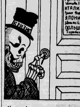
У дверей капиталистического мира (общий гость).