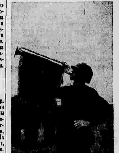
Горист Н-ского стрелкового полка (Московский военный округ).

Сегодня рано утром, когда трудящиеся великой советской страны выйдут на демонстрацию, все радиостанции СССР начнут праздничные передачи. Ровно в 9 часов 30 минут начнется трансляция с Красной площади. Во время демонстрации на Ленинград, Киев, Минск и других городов будут переданы сообщения о ходе первомайских торжеств. В первомайские дни будут транслироваться большие концерты при участии лучших артистических сил и самодеятельных коллективов. Кроме того, завтра, в 19 часов 30 минут, состоится передача праздничного концерта из четырех городов — Москвы, Ленинграда, Киева и Минска. Сегодня, в 23 часа 10 минут, и завтра, в 12 часов, будет транслироваться запись на звуковую пленку первомайского парада на Красной площади и демонстрации трудящихся Москвы.