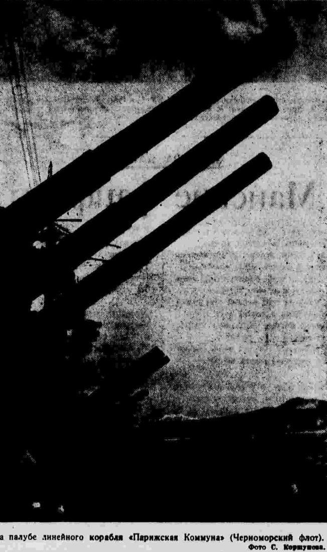
На палубе линейного корабля «Парижская Коммуна» (Черноморский флот).

В Историческом музее (Москва) открылась выставка, посвященная 1 мая. Среди документов большой интерес представляют фотографии первомайских демонстраций в СССР. Одна из них — «Парады на Красной площади в 1904 г. (вспомните — это было в 1904 г.)».