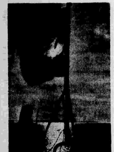
На вахте (Черноморский военный флот).

«В день 1 мая рабочий класс, — говорится далее в обращении, — вновь подтверждает свою преданность делу мира. Мир может быть сохранен только путем осуществления коллективной безопасности и соблюдения международного права. Рабочий класс подтверждает свою преданность знамени мира — великому Советскому Союзу, который разгромил пролетарскую агентуру международного фашизма. Рабочий класс вновь заявляет о своей солидарности с борьбой испанского народа, стремящегося к освобождению от фашистского ига, и выражает надежду на скорейшее освобождение Испании от фашистского ига».