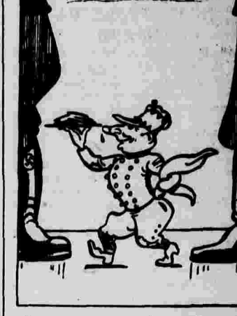
Слуга двух господ (польский коридорный).