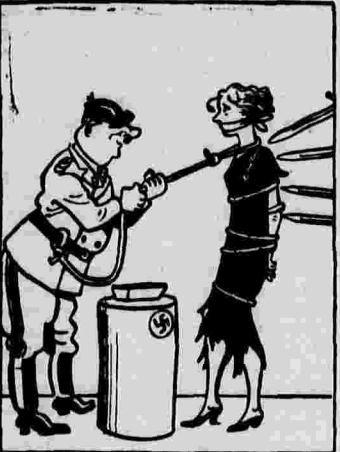
Гитлер (Австрия):—Я не сомневался в вашей привязанности ко мне.