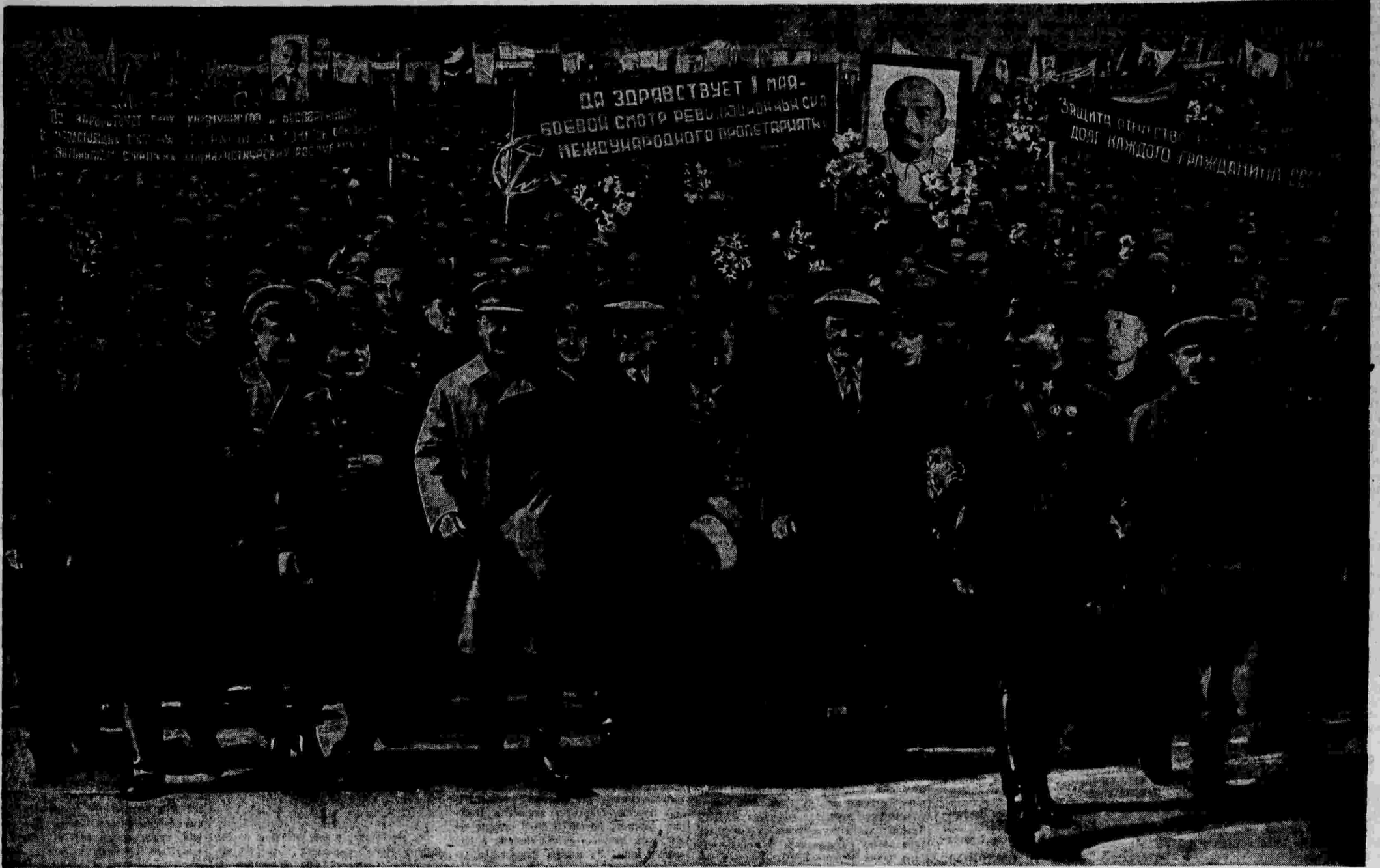
ВЕЛИКИЙ ПРАЗДНИК 1-го МАЯ.

Пролетарии всех стран, соединитесь! Становитесь под интернациональное знамя Маркса-Энгельса-Ленина-Сталина!