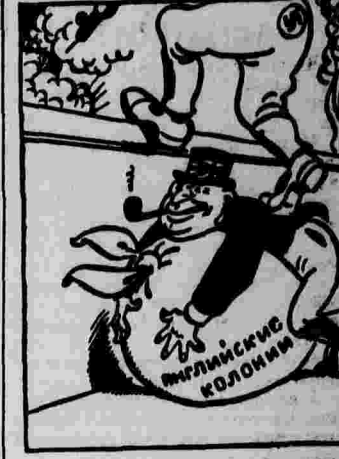
Английский трамвайный интервенция.