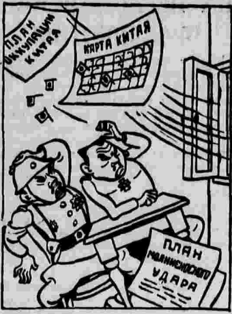
Китайский весенний ветер в японском генштабе.