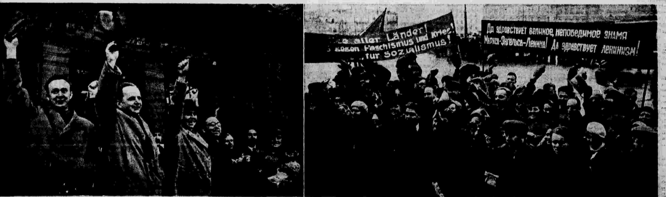
Делегатами рабочих Чехословакии и Франции прибыли в Москву на первомайские торжества. На снимках: слева — иностранные делегаты на Белорусском вокзале; справа — трудящиеся Москвы приветствуют гостей.

В неуклонном и решительном осуществлении этой сталинской заповеди лежат залог победы международного пролетариата.