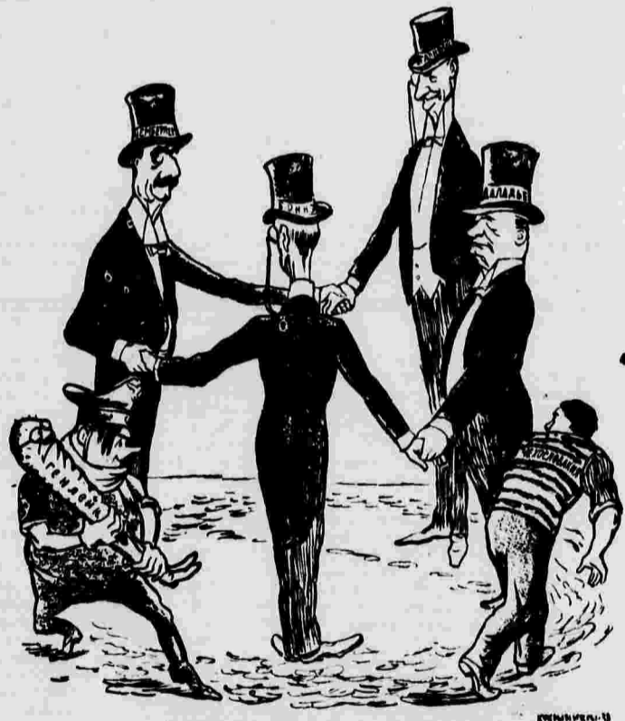
«Англо-французская игра в кошки-мышки»