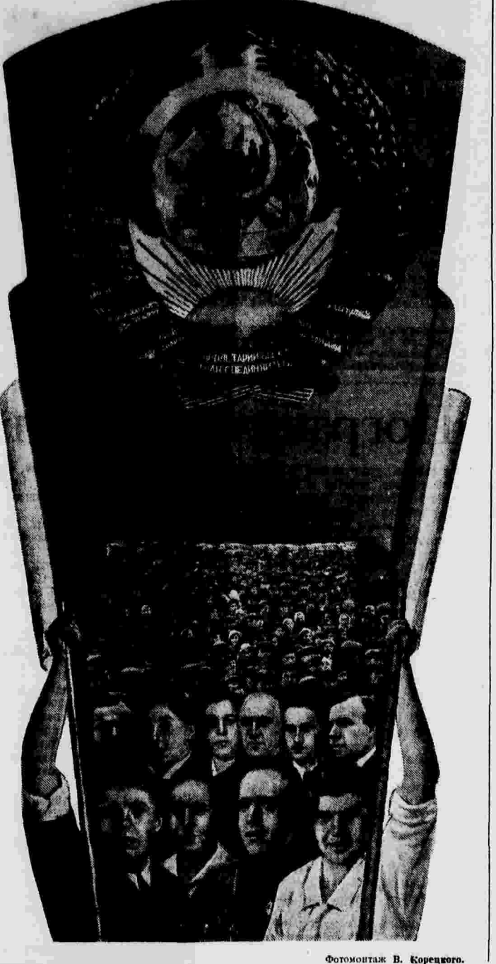
Фотомонтаж В. Корнеева.

В апреле тов. Емков переведен на наладочную работу в члены коммунистической партии.