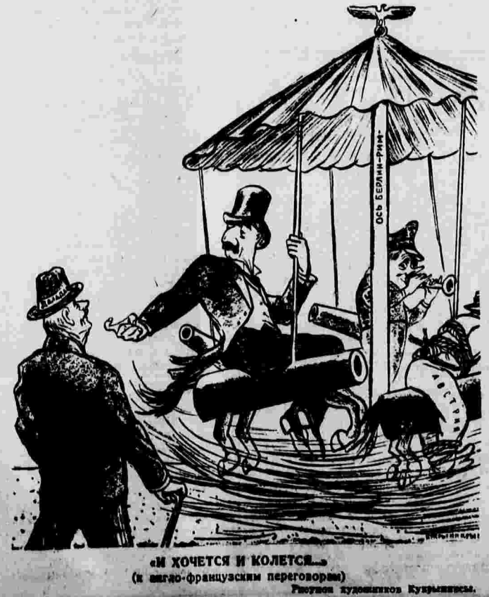
«М ХОЧЕТСЯ И КОЛЕТСЯ» (к англо-французским переговорам)

Поступившая на варшавскую биржу информация о восточных районах Польши привела к падению котировки на 800 тысяч злотых.