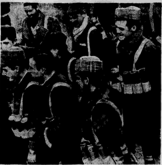
Героические гранатометчики испанской республиканской армии на фронте.

Представитель СССР в Комитете по невмешательству тов. Майский уже 10-й раз от 29 сентября прошлого года от имени советского правительства указал на абсолютную несправедливость создавшегося положения и поставил вопрос о ликвидации столь несправедливой системы контроля. Вслед за этим нотой от 26 октября он уведомил Комитет о прекращении платежей со стороны СССР на поддержание этой «системы». Германия и Италия также прекратили платежи. За ними скоро последовали Англия, Франция, а также и некоторые другие державы. В результате создался затяжной финансовый кризис. С каждым месяцем положение все более обострялось. И, наконец, секретариат Комитета по невмешательству вынужден был оставить перед Комитетом вопрос о том, что же делать дальше. По расчетам секретариата, наличный фонд должен был хватить лишь до 1 мая. И в случае отсутствия дальнейших пополнений вся пресловутая «система» контроля после этого члена подлежала бы ликвидации. Вот по этому вопросу lord