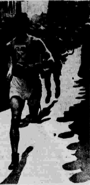
Открытие легкоатлетического сезона в Киеве. На снимке: весенняя эстафета киевских физкультурников по улицам столицы Украины.