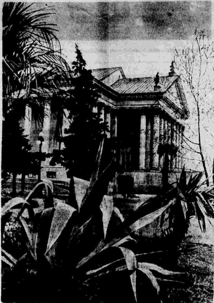
Здание нового театра в Сочи.

С большим подъемом прошли митинги по предприятиям и службам железнодорожного узла Чубарево. В своих резолюциях железнодорожники обязались хорошо изучить Конституцию Украинской ССР и Положение о выборах, обеспечить стопроцентную явку к избирательным урнам и единодушно голосовать за блок коммунистов и беспартийных.