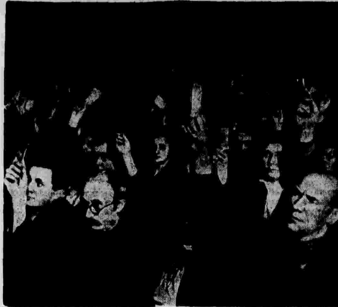
На партийной конференции завода «Красный треугольник» (г. Ленинград). На снимке: момент голосования резолюции по отчетному докладу парткома.