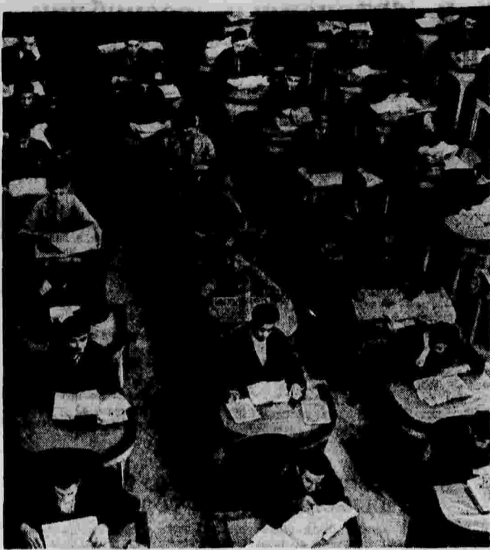
В читальном зале городской библиотеки им. В. И. Ленина в гор. Баку.