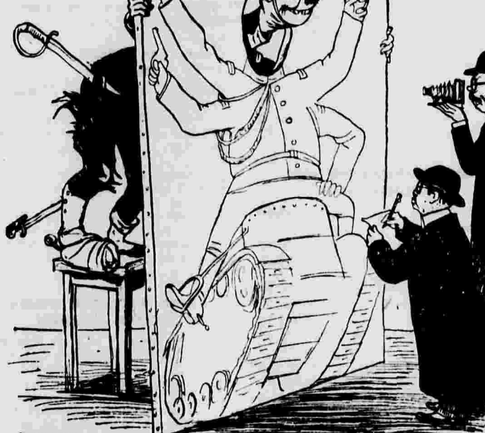
«Хорошая мина при плохой игре». Рисунки художников Кукринского.

Японским газетам запрещено сообщать что-либо о неудачах японских войск на фронтах в Китае.