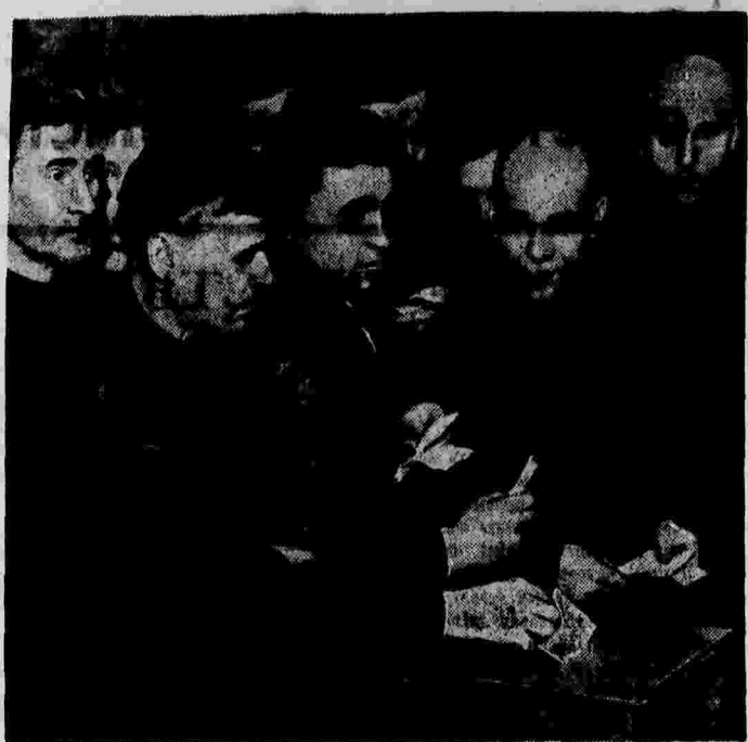
Отчетно-выборное партийное собрание на железнорудном цехе завода «Красное Сормово» (г. Горький). На снимке: выборы цехового партийного комитета.

Борьба за технико-экономическую независимость страны Советов требовала оснащения промышленности новейшим в техническом отношении оборудованием и созданию совершенно новых, никогда не существовавших в России, отраслей промышленности. Создание социалистической промышленности вызвало необходимость завода технически совершенного оборудования лучших американских и европейских фирм.