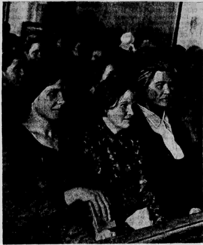
На отчетно-выборном собрании партийной организации льнопрядильной фабрики «Красный Октябрь» (гор. Горький).

Необходимо, чтобы партийные руководители и вся масса коммунистов хорошо знали инструкцию о выборах. Партийные комитеты обязаны внимательно и оперативно следить за ходом выборов. Их представители должны побывать на возможных выборах, в первую очередь на собраниях тех организаций, которым руководят молодые, недостаточно опытные работники. Одно из условий большевистского руководства выборами — это хорошо организованная информация о том, что делается на отчетно-выборных собраниях. Ни одна ошибка не должна пройти мимо партийного комитета. Малейшее нарушение инструкции, партийной демократии необходимо не только на месте исправить, но и сделать уроком для остальных партийных организаций.