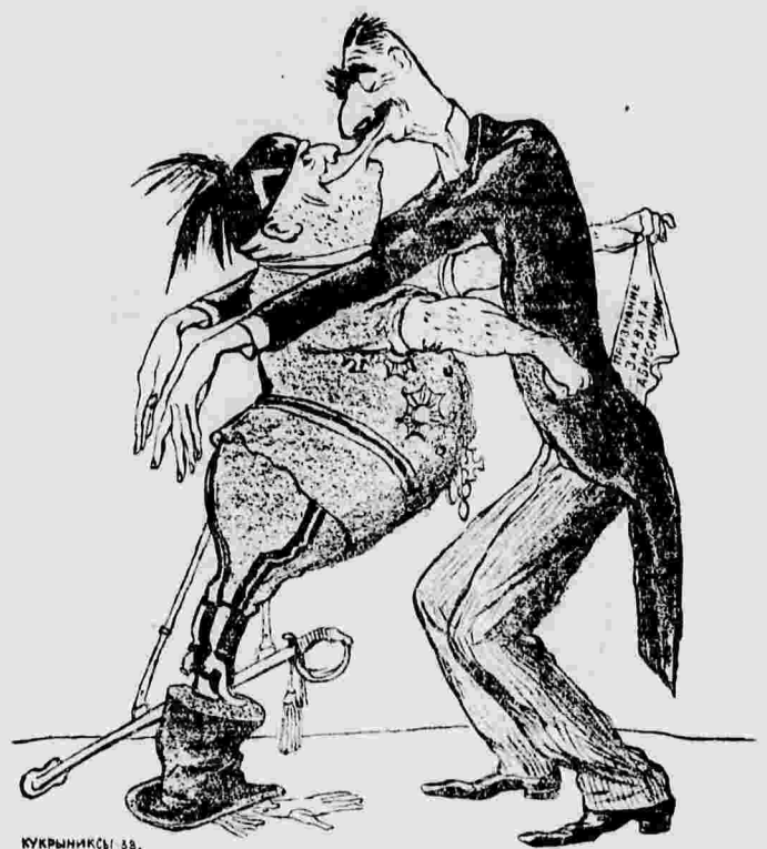
«Англо-итальянский союз». Рисунок художника Кукрыникова.

Делегаты партии, как говорится в сообщении, должны подчеркнуть в своих резолюциях «солидарность крестьян с рабочим движением» и заверить рабочий класс в своей готовности бороться совместно с ним против фашизма, за демократические свободы.