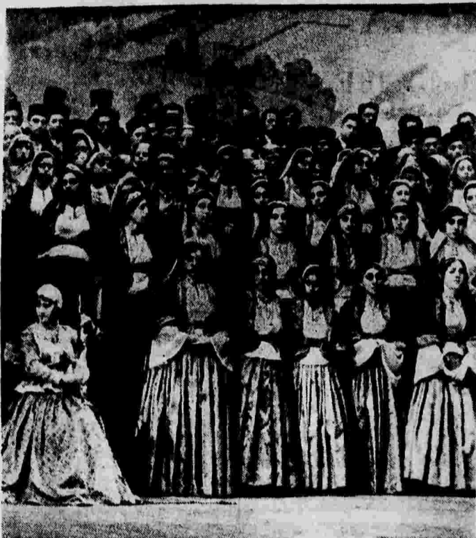
Выступление хора Азербайджанской Государственной филармонии под управлением народного артиста Азербайджанской ССР композитора Узера Гаджибекова.

Проф. А. АЛЕКСАНДРОВ, народный артист СССР, орденосица.