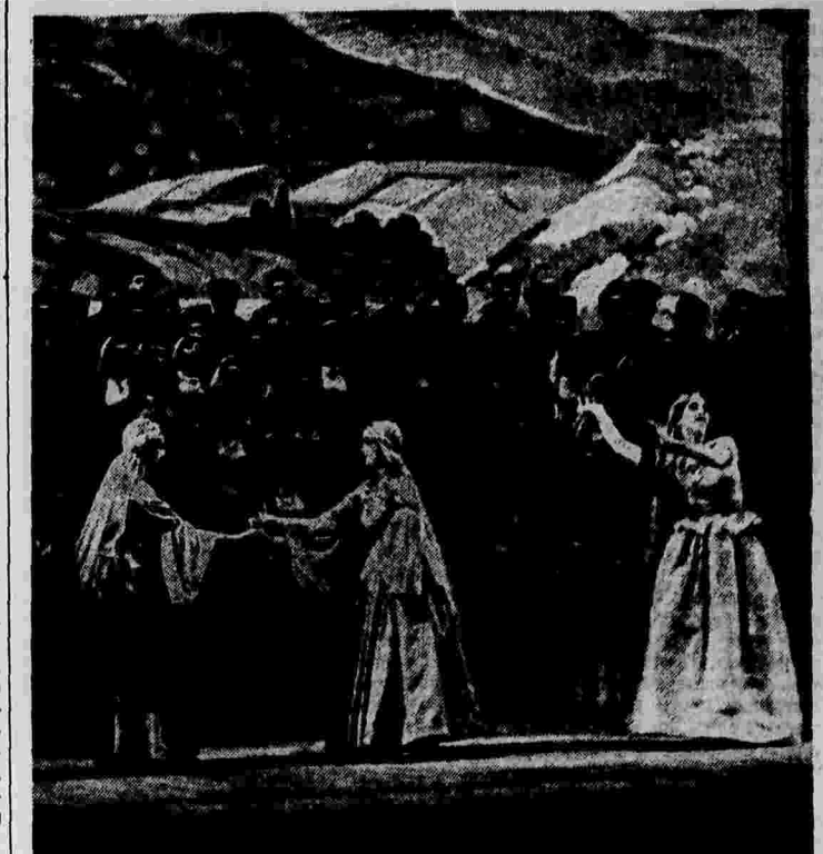
Декада азербайджанского искусства в Москве. Заключительный концерт в Большом театре. На снимке: выступление женского танцевального ансамбля.

Реакционная группа членов палаты представителей и беседе с представителями печати подвергла резкой критике послание Рузвельта.