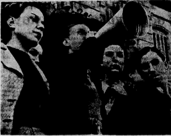
Правительство республиканской Испании проводит 100-тысячный призыв добровольцев. На снимке: группа молодежи на улицах Барселоны агитирует за вступление в армию.