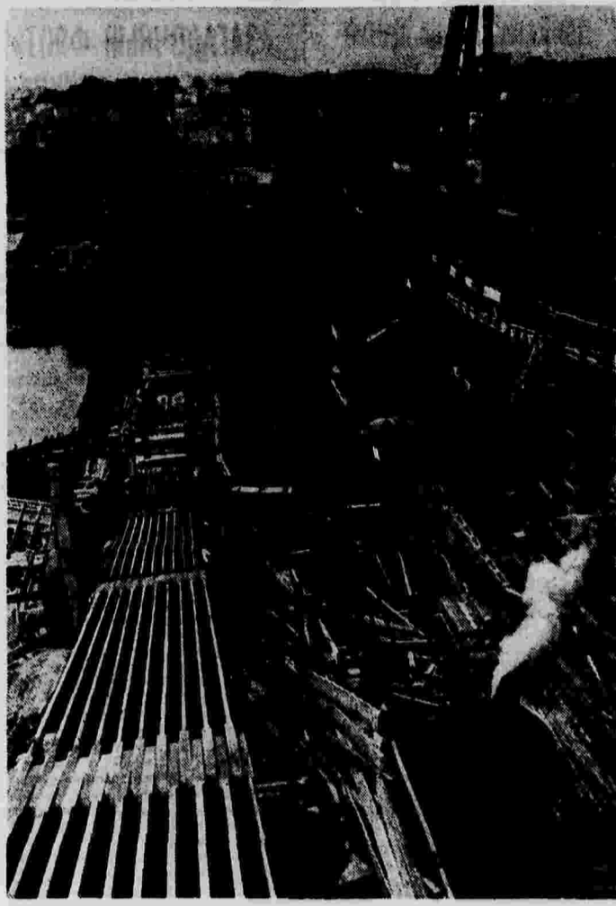
Строительство нового высшего Крымского моста через Москва-реку.