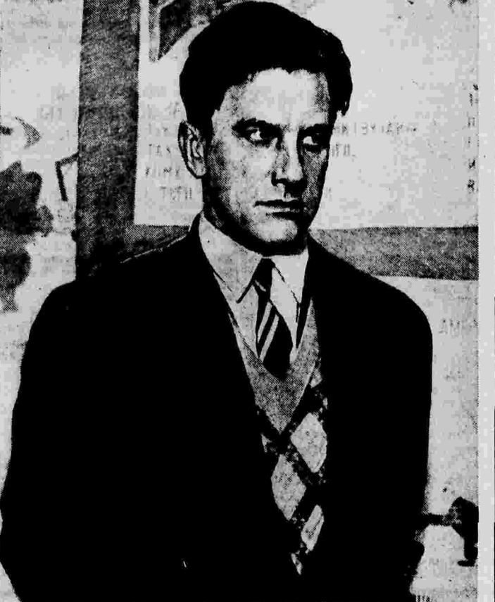
В. В. МАЙКОВСКИЙ.

Длина моста — 436 метров, ширина — 30 метров. Движение по путепроводу намечается открыть в ноябре.