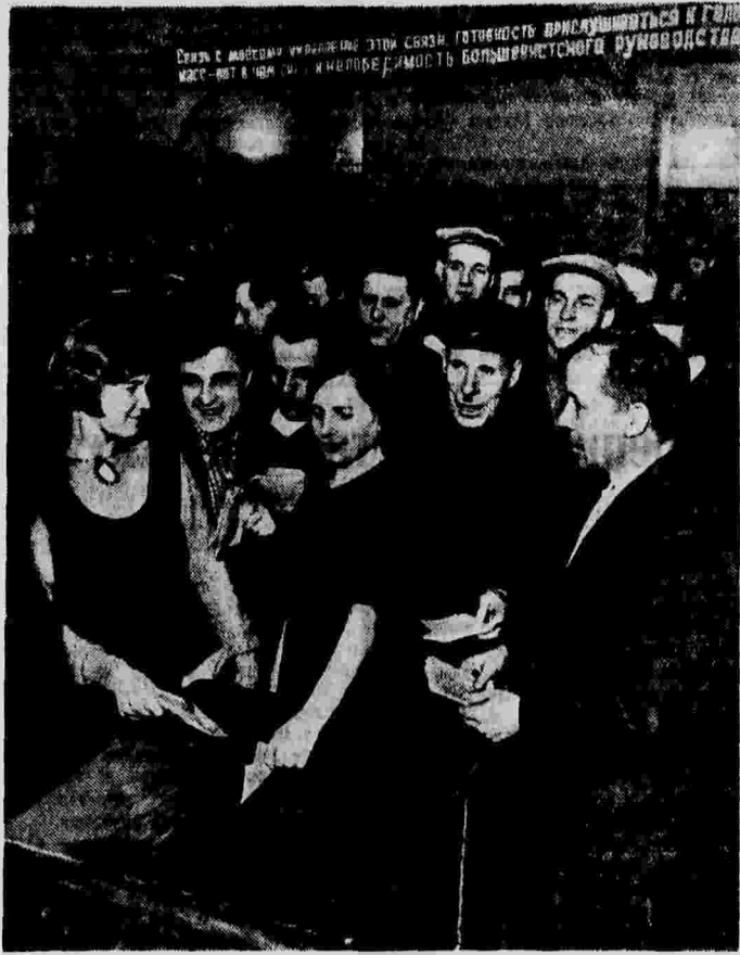
Отчетно-выборное партийное собрание на заводе «Динамо» им. С. М. Кирова (Москва). На снимке: выборы нового заводского партийного комитета тайными голосованием.