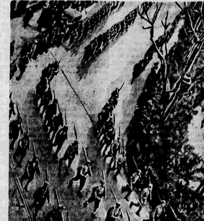
Курсанты каталонской военной школы проходят по улицам Барселоны перед отправкой на арагонский фронт.

Однако подлые изменники, презренные враги китайского народа, китайские троцкисты, находящиеся в Сингапуре, всячески пытаются сорвать патриотическое движение китайских патриотов, натравливая на них местные английские власти. Одни из этих выродков — японский шпион Гуань Цу-