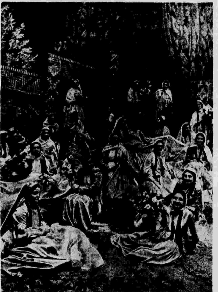
Декада азербайджанского искусства в Москве. На снимке: сцена из 1-го действия оперы «Шах-Сенем».

тели главных ролей оперы — народная артистка Шовкет Ханум Мамедова (Шах-Сенем) и заслуженный артист Бюль-Бюль (Гариб). Помог композитору и автор азербайджанского текста оперы талантливый поэт и драматург Джаффар Джабарлы.