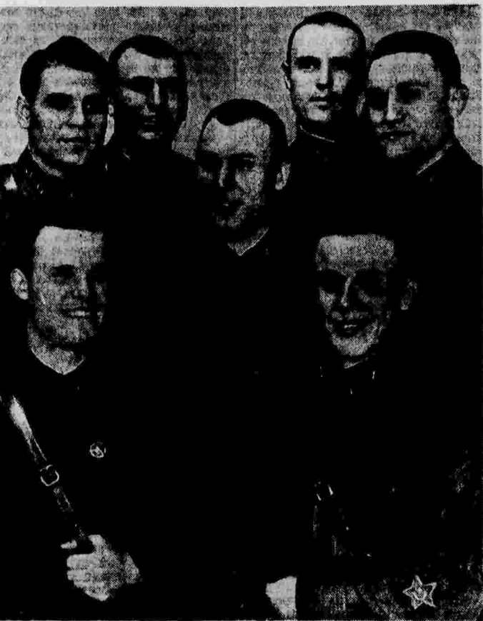
Группа заместителей политруков — артиллеристов Особой Краснознаменной ордена Ленина кавалерийской дивизии имени Сталина.