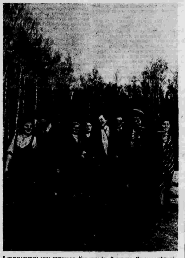
В подмосковном доме отдыха им. Калинина (ст. Тарасовка, Ярославской ж. д.).