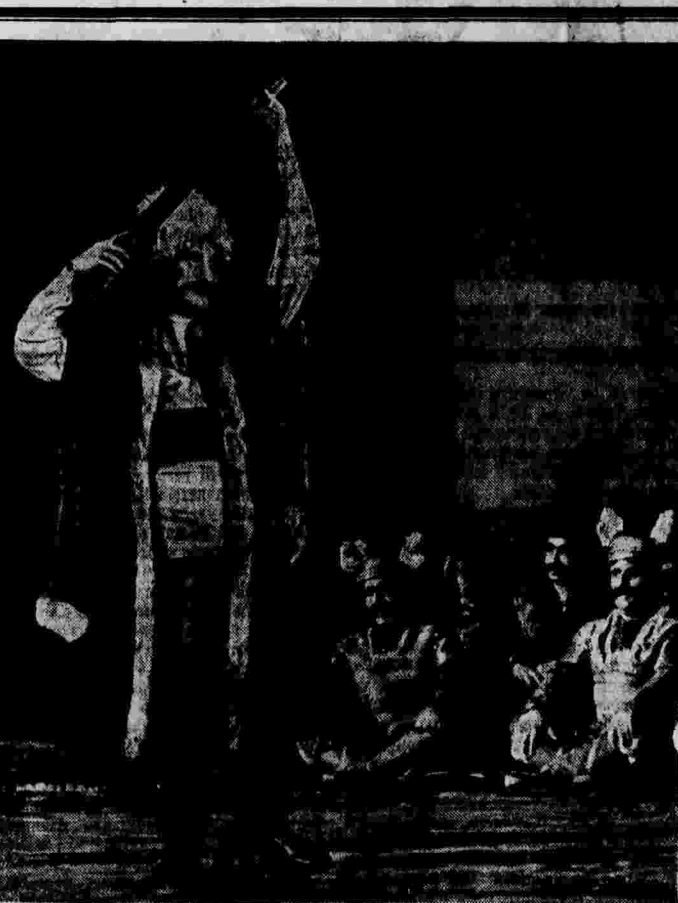
Азербайджанская опера «Кер-Оглы». Заслуженный артист Азербайджанской ССР Бюль-Бюль в роли Кер-Оглы (4-е действие).

Жизнерадостная, солнечная музыка увертюры захватывает слушателя. Здесь все просто и одновременно ясно. Гаджибеков отлично владеет красками оперного оркестра. Музыкальная ткань «Кер-Оглы» чем-то напоминает яркое и нежные тона ковор азербайджанских мастериц-художниц. Те же неуловимые переходы цветов, передают красок.