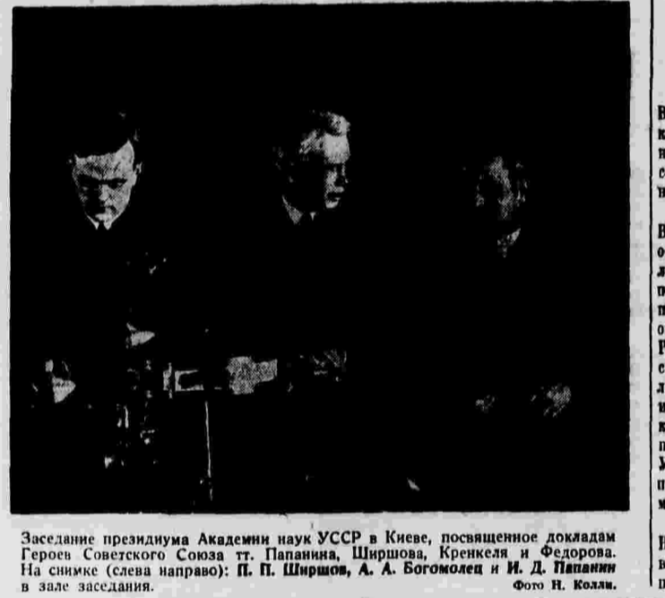
Заседание президиума Академии наук УССР в Киеве, посвященное докладом Героев Советского Союза тт. Панина, Ширшова, Кренкея и Федорова. На снимке (слева направо): П. П. Ширшов, А. А. Богомолец и И. Д. Панин.

по вопросам подготовки к выборам. На партийных собраниях в первичных организациях постановлено ЦК ВКП(б) и инструкция будут изучаться с 7 по 11 апреля. С 15 апреля по 15 мая во всех партийных организациях города состоится выборы руководящих партийных органов.