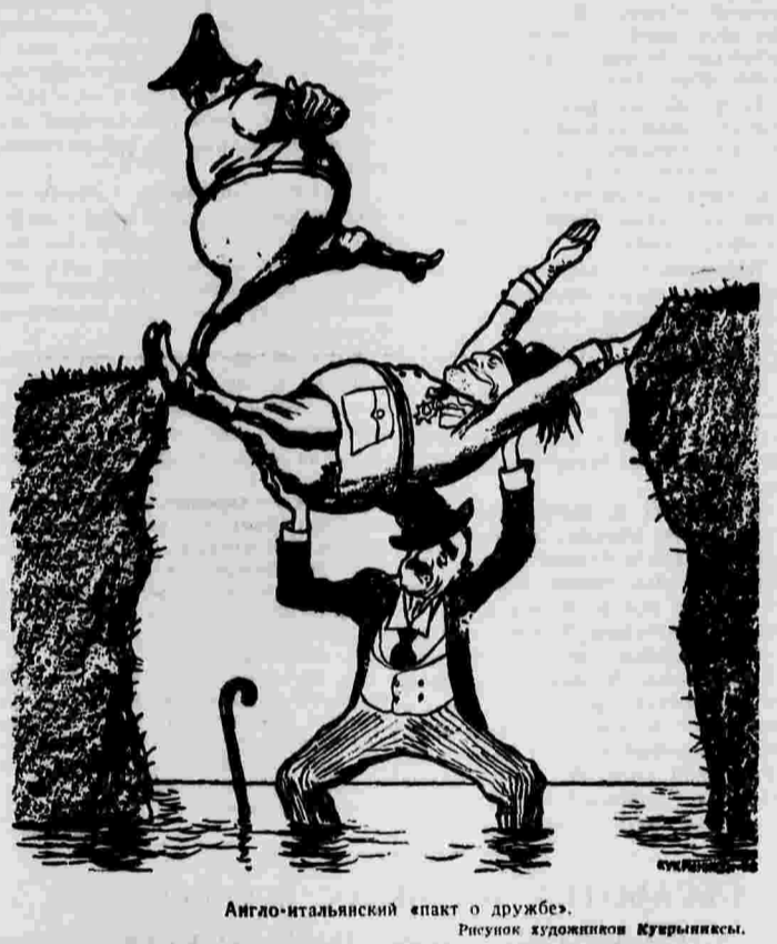
Англо-итальянский пакт о дружбе. Рисунок художника Куварыксы.

РИМ, 4 апреля. (ТАСС). В Италии начался автомобильный пробег через ряд гор. Первый же день пробега ознаменовался многочисленными несчастными случаями. Машины, мчавшиеся по общим дорогам с большой скоростью, несколько раз врезались в толпу прохожих и зрителей. В Болонье оказалось 10 человек убитых и 26 раненых. В Ферара 6 человек доставлены в госпиталь в бессознательном состоянии, в Кремоне ранено двое.