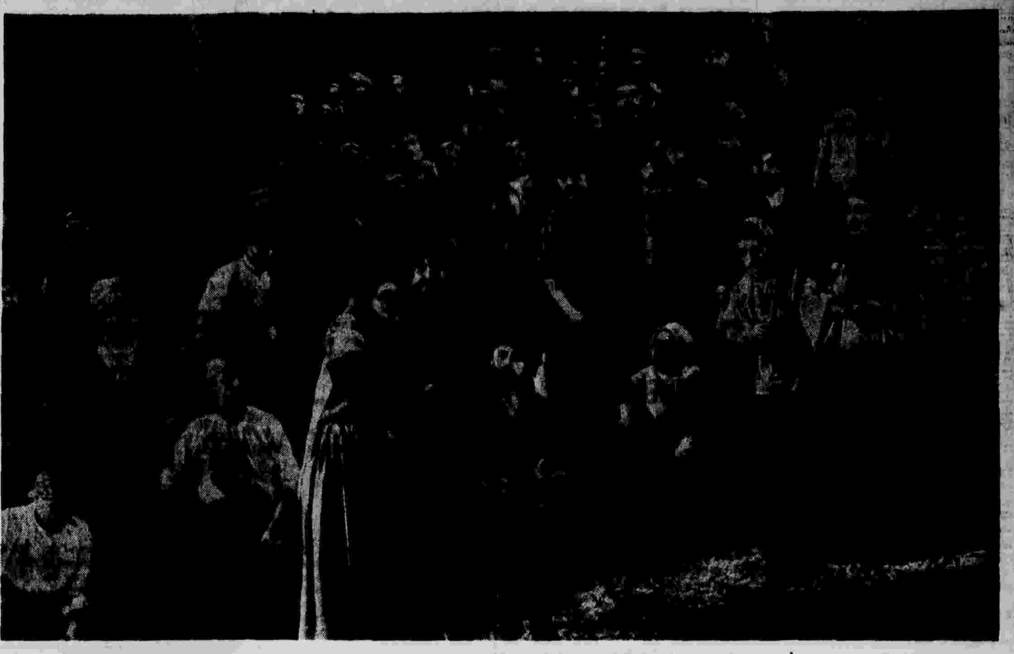
Декада азербайджанского искусства в Москве. На снимке: сцена из первого действия оперы «Кер-Оглы».

Фашистские провокации против Чехословакии ПРАГА, 5 апреля. (ТАСС). Вж сообщает газета «А-бет», 3 апреля 6 ч. в Варшаве (северная чехословацкая граница) германские фашисты устроили организованную провокацию. На границу прибыло несколько автобусов, на которых находилось около 400 чехословацких (СА) в форме и в гражданском.