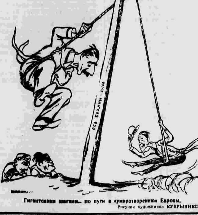
Гигантский шнганг... по пути к «умиротворению» Европы. Рисунки художников КУКРИНИКСА.