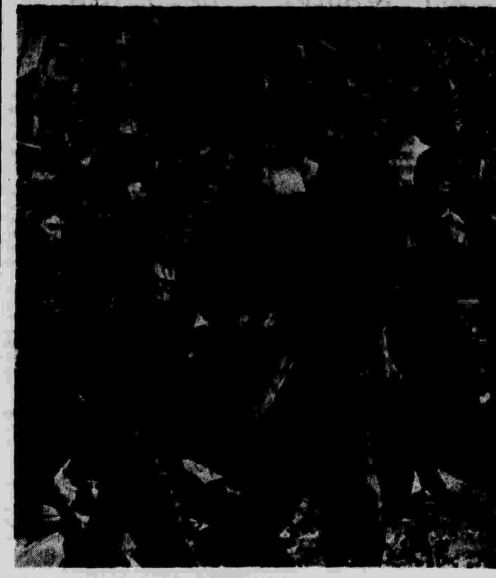
Бомбардировка Барселоны. Отряды первой помощи среди развалин разрушенных бомбардировкой зданий.

Германская печать выступает также с резкой критикой последнего выступления чехословацкого премьера Годжи. При этом фашистские газеты в угрожающем тоне пишут о том, что «господствующему положению чехов над национальными меньшинствами должен быть положен конец».