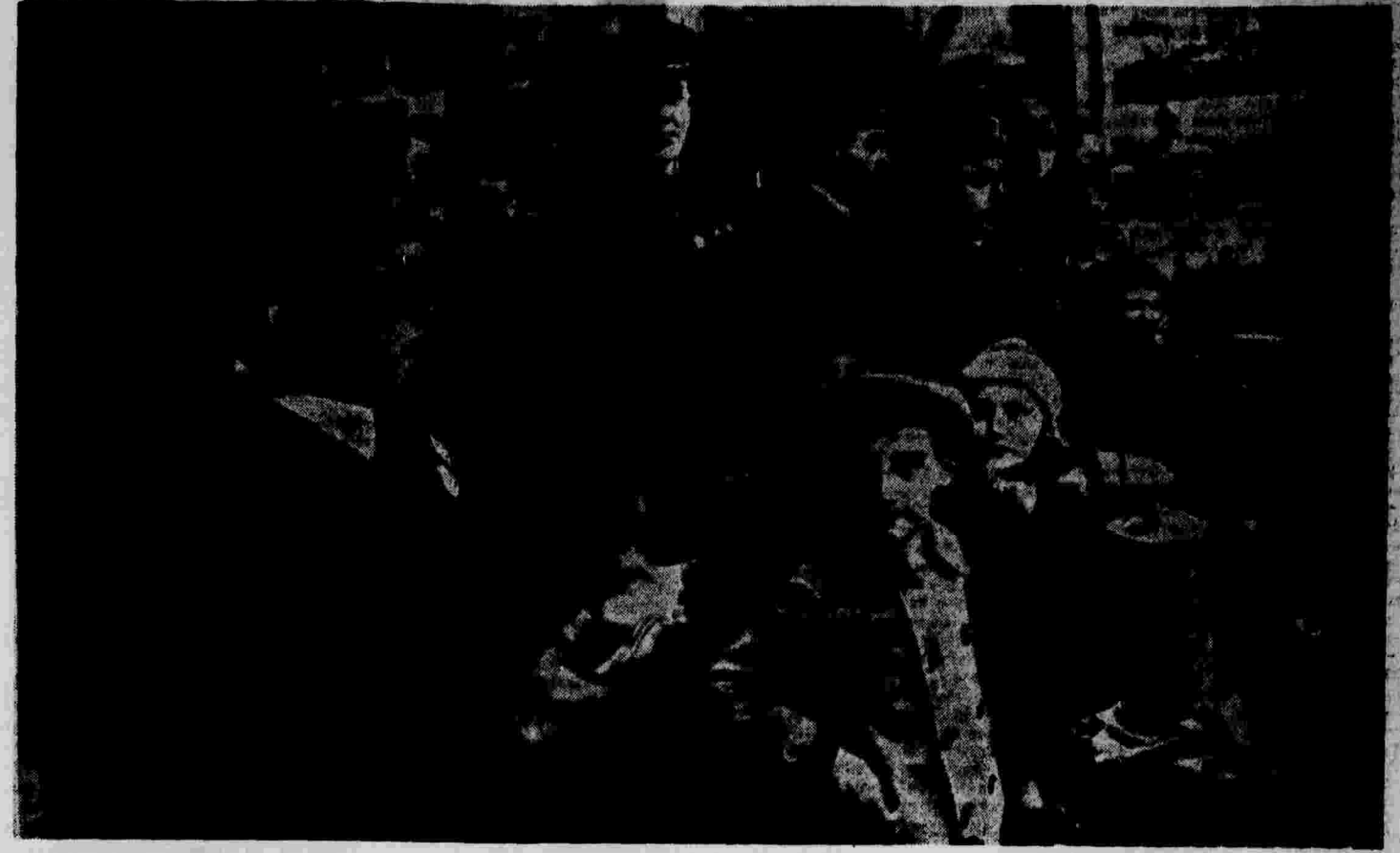
Герои Советского Союза М. Д. Папанни, П. П. Шаршов, Э. Т. Кренкель и Е. К. Федоров в Киеве. На снимке: митинг на площади около вокзала. Выступает П. П. Шаршов.

Огромное желание стать командиром, мечта о военной специальности владеет многими красноармейцами. По приказу народного комиссара обороны маршала Советского Союза тов. Ворошилова в нынешнем году кандидатами из красноармейцев и младших командиров предоставляется ряд льгот — они будут приниматься в военные училища в первую очередь. В училища принимаются красноармейцы и младшие командиры из частей РККА и находящихся в долгосрочном отпуску в возрасте до 24 лет, тогда как для остальных молодежи возраст ограничен 23 годами.