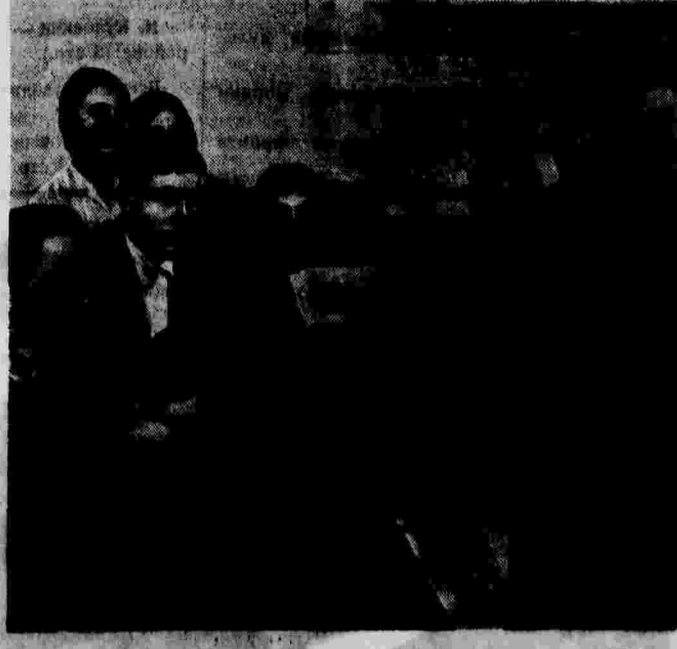
Кружок по изучению... Лекции для актива московской партерорганизации

Красноярск, 31 марта... Обмен опытом пропагандистской работы