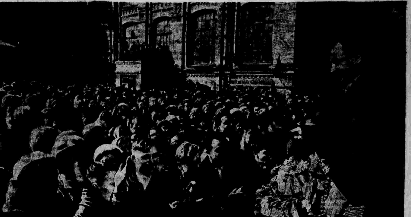
Выступление Героя Советского Союза тов. И. Д. Панинина перед рабочими и служащими Часового завода № 1 им. С. М. Кирова (г. Москва).

УХУЩЕНИЕ ЭКОНОМИЧЕСКОГО ПОЛОЖЕНИЯ В США НЬЮ-ЙОРК, 30 марта. (ТАСС). В связи с дальнейшим ухудшением экономической конъюнктуры в США резко упали курсы важнейших акций. Многие акция находятся сейчас на самом низком уровне, начиная с 1932 г. 29 марта индекс Доу-Джонса показал дальнейшее снижение на 5 пунктов и сейчас упал до 102 против 190 в середине августа 1937 г.