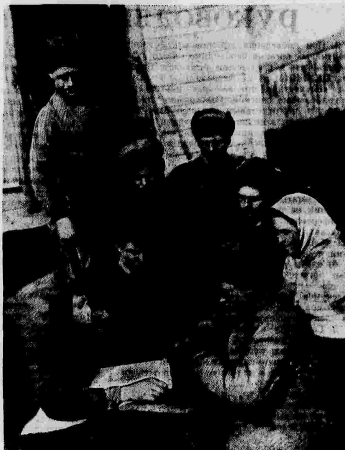
Читка газет в полевом стане трактористов и прицепщиков 20-й тракторной бригады Азовской МТС (Ростовская область).

водческих и тракторных бригадах, знакомят колхозников и трактористов с важнейшими решениями партии и международными событиями.