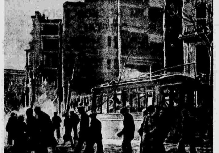
Итапо-германская воздушная бомбардировка Барселоны. На снимке: улица города после очередного налета фашистских самолетов. Справа — трамвай, в котором были убиты все пассажиры.

ВАРШАВА, 29 марта. (ТАСС). Польские газеты весьма сочувственно комментируют подрывную работу гитлеровцев и сподвижников клериков в Чехословакии. Печать сообщает, что в Тешине (Чехословакия) создано «общество союзов поляков», которое, по примеру Генлейна, выдвигает лозунг «полной территориальной автономии для польского меньшинства». В программной декларации об «единении, составленной в весьма агрессивном тоне, между прочим, говорится: «До тех пор, пока мы не получим своих домовых этой земли, все же разговоры о польско-чехословацком объединении будут только пустой фразой».