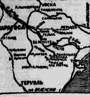
Сектор Букарлес. Кавалерийская атака противника.