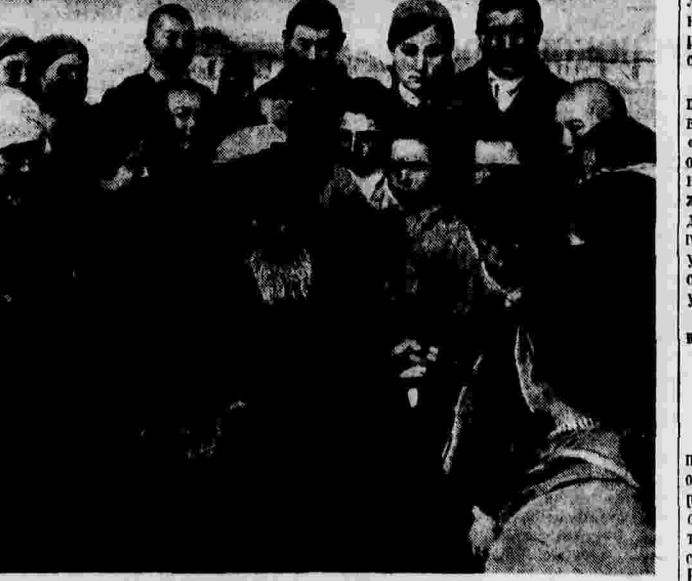
Народный певец Казахской ССР, орденносец Джамбул, среди юных слушателей — колхозных ребят колхоза «Ернарар» (Кастекский район, Алма-Атинской области).

На фабрике устанавливается 5 зарубежных машин-автоматов, которые будут изготовлять коробки и пакеты и наполнять их точно отмеренными порциями продуктов. Производительность фабрики — 56 тонн в смену.