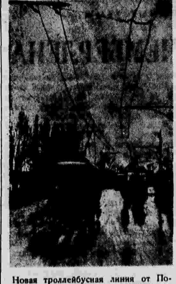
Новая троллейбусная линия от Потыльки до Каульской заставы по новой автомагистрали через Ленинские горы (Москва).

Народы бережно просят через столетия чудесные легенды и сказания о своей борьбе за свободу и независимость, о своей борьбе против захватчиков и поработителей. В истории человечества немало таких героических страниц, немало чудесных рассказов о народных богатырях, ставших во главе движения масс против иноземных посях.