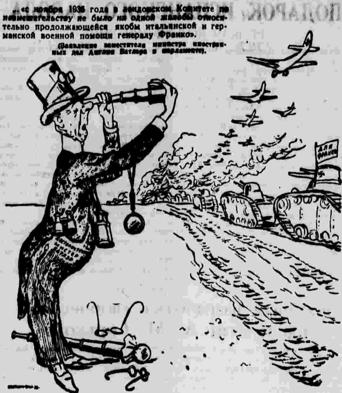
Английская куриная слепота. Рисунки художников «КУКРЫНИКСЫ».