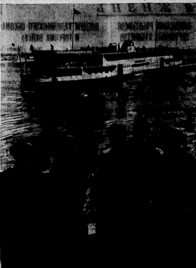
Открытие навигации на Днепре. Пароход «Маршал Ворошилов» отходит от Киевской пристани в Днепропетровск.

В области создается угрожающее положение. Выполнено всего 80 проц. плана ремонта тракторов. Есть МТС, где подготовлено менее половины парка, хотя до сева осталось буквально считанные дни. Нетрудно подсчитать, сколько при таких темпах потребуется времени, чтобы отремонтировать все машины. Некоторые МТС и ориентируются на поздние сроки. Заместитель директора Орловско-Таловской МТС по подготовке тов. Сазыкин на совещании отозвался так: «Не спешим, задела!»