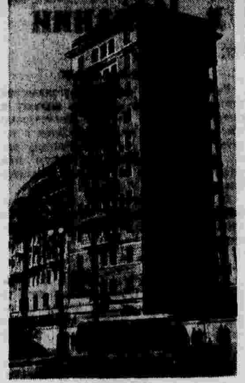
Строительство жилого дома в столичном районе Героев Советского Союза в Тимирязевском районе. На снимке: правая часть дома — 11-этажная башня.

8. Обеспечить такой порядок, чтобы каждый депутат Московского Совета мог быть принят в любой день одним из членов президиума Моссовета и, кроме того, участвовать в каждом первом заседании пленума от 7 до 11 часов вечера обязательные часы приема депутатов Московского Совета членами президиума Моссовета.