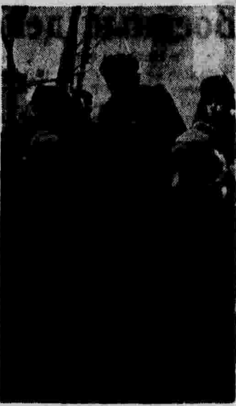
Четвероногий спутник панинцев...

21 марта на железных дорогах Союза погрузили 81.322 вагонов — 98,9 проц. плана, выгрузили 88.116 вагонов — 91,3 проц. плана.