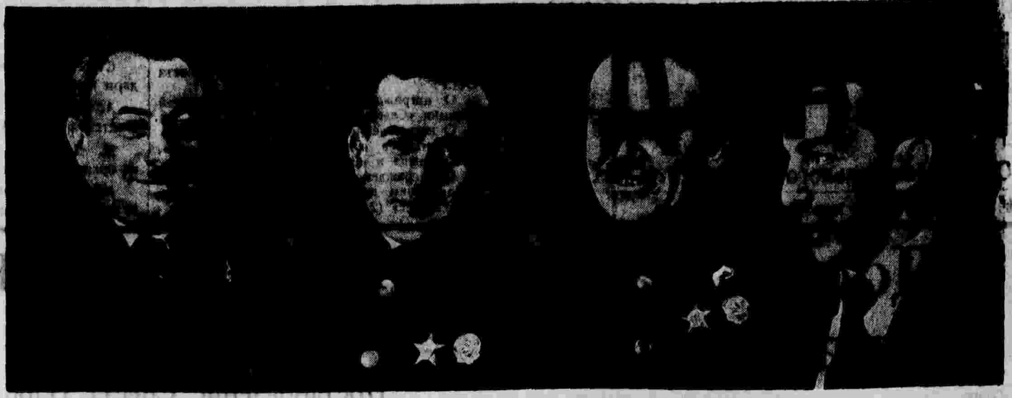
Герои Советского Союза: И. Д. Панинин, П. П. Шаршов, Э. Т. Крешнев и Е. К. Федоров.