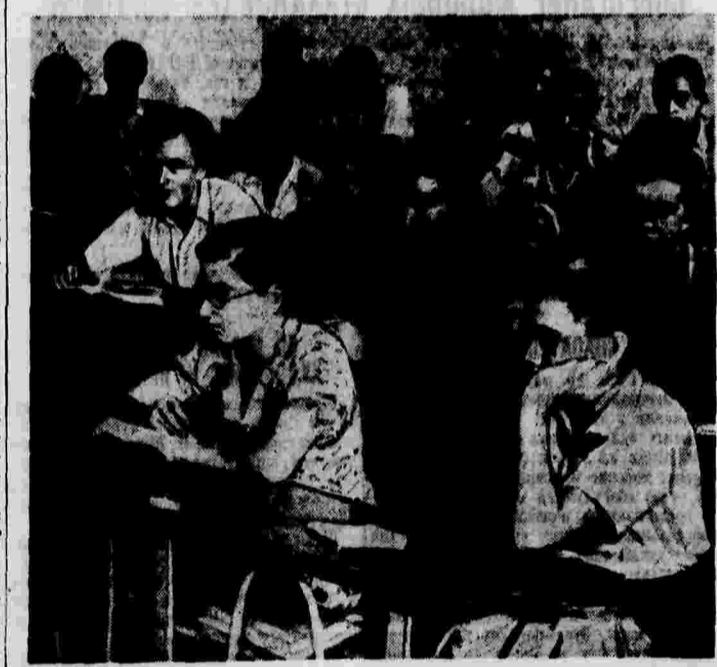
Республиканское правительство Испании за время войны открыло ряд рабочих факультетов. На снимке: занятия на рабфаке в Валенсии.

ЛОНДОН, 19 марта. (Соб. инфор.). По сообщениям из Парижа, французское правительство заявило генералу Франко резкий протест против авиации на Барселону. Одновременно французское правительство переслало английскому правительству точный список 442 итальянских и германских самолетов, принимавших участие в военных действиях на стороне Франко.