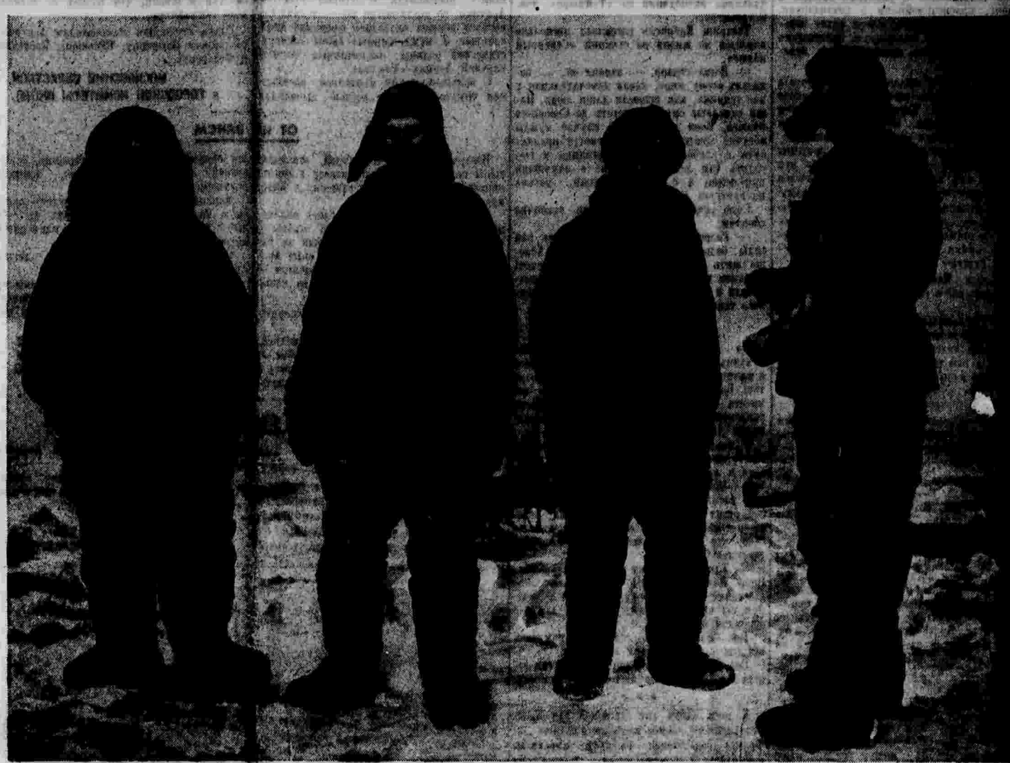
ГЕРОИ-ПОЛАРИКИ НА ДРЕЙФУЮЩЕЙ ЛЬДИНЕ.

Октябрь 19 февраля 1938 года специальным корреспондентом «Правды» В. Тешкиным.