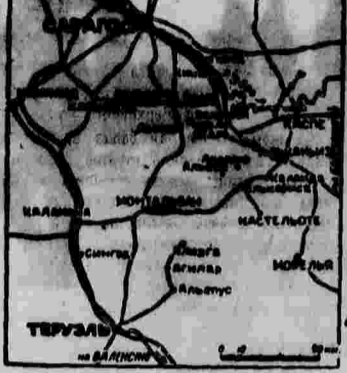
На центральном и южном фронтах — без перемен.

Испанское министерство обороны сообщает, что 14 марта мятежники достигли Альканьяса и Калады (в юго-запад от Каспе). Альканьяс был занят итальянской моторизованной колонией.