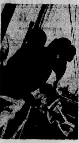
Капитан ледокола «Ермак» тов. И. Ф. Котов на борту корабля.

27 февраля на железных дорогах СССР погрузили 77,871 вагон — 81,8 проц. плана, выгрузили 74,811 вагонов — 96,8 проц. плана.