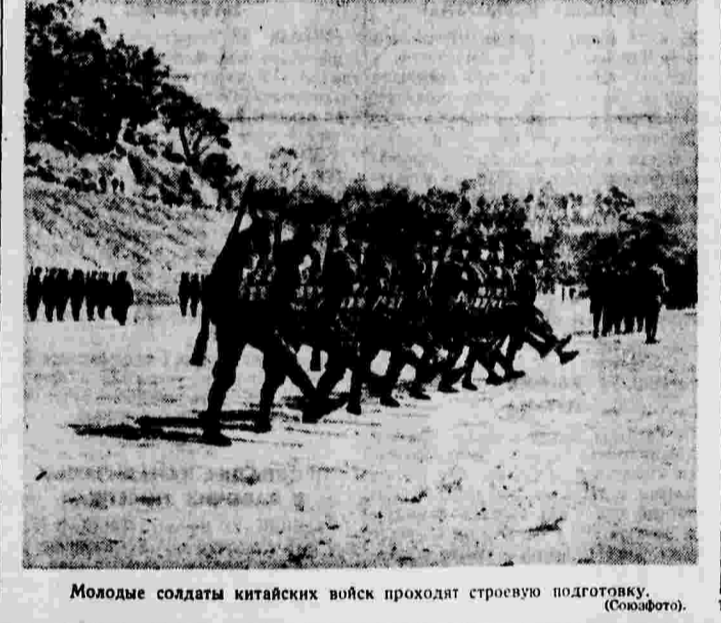
Молодые солдаты китайских войск проходят строевую подготовку. (Союзфото).

БРЮССЕЛЬ, 27 февраля. (ТАСС). В начале января 1938 г. число официально зарегистрированных безработных в Бельгии составило 224.435 человек против 163.831 в январе прошлого года. Следует отметить, что за одну лишь первую неделю января число безработных возросло на 27.441 человек.