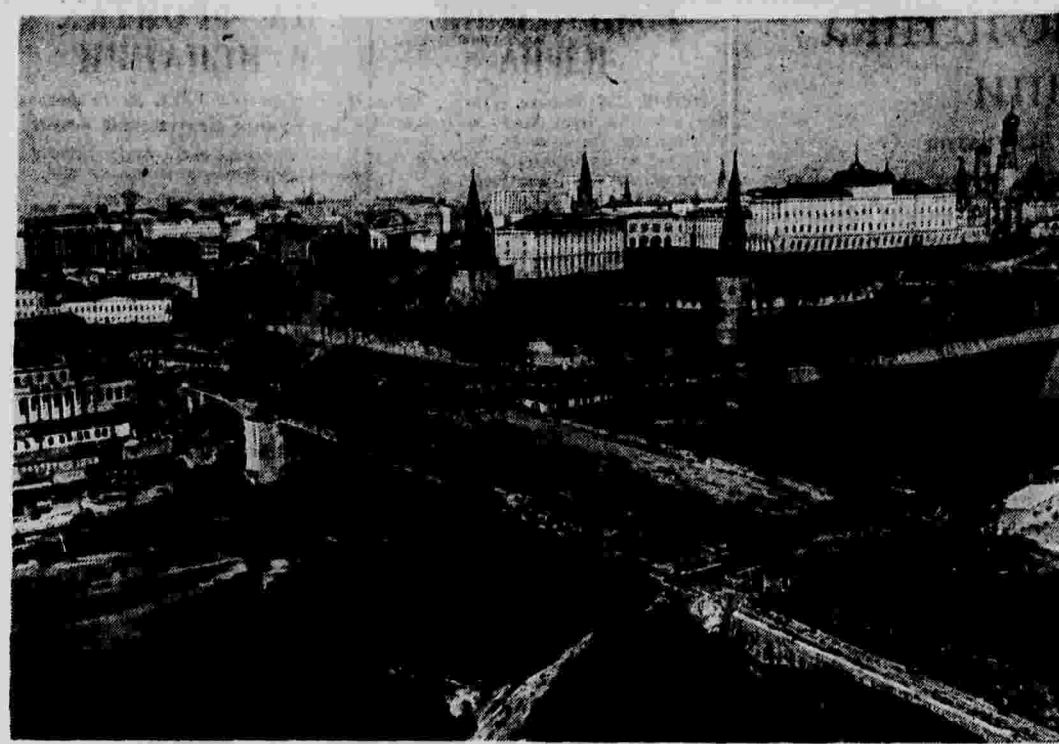
Панорама строительства нового Большого Каменного моста через Москва-реку.

Охота в марийских лесах. В прошлом году охотники Марийской АССР следили за охотой в 100 тыс. гектарах леса. Удачно идет охота и в этом году.