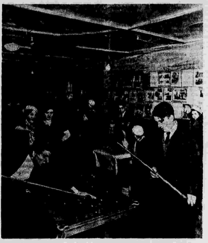
Вечером в избачитальном колхозе «Завет Ильича», Ленинского района, Московской области.

ПНГРП, Курской области, 26 февраля. (Мор. «Приморье»). В Широкском районе в партийных кружках практикуется бесперебойная смена пропагандистов. 35 руководящих кружков из 39 по несколько раз перебарывались с места на место. В кружке по изучению истории партии на фосфоритном заводе за 2 года сменилось 14 пропагандистов. В партийной школе при Чернавском сельсовете за 2 месяца сменилось 3 пропагандиста.