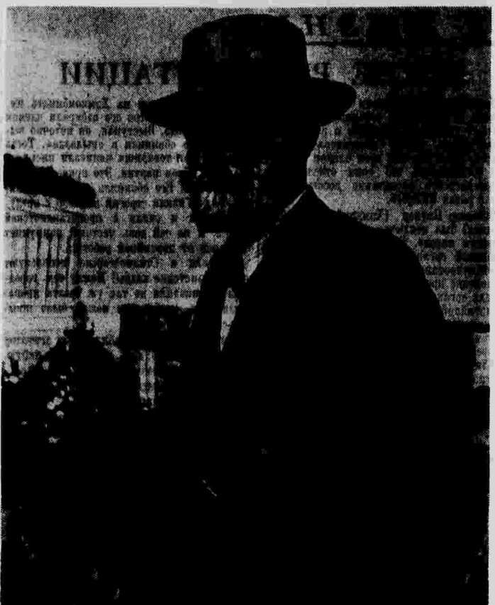
Академик И. П. Павлов в Колтухах (1935 г.)