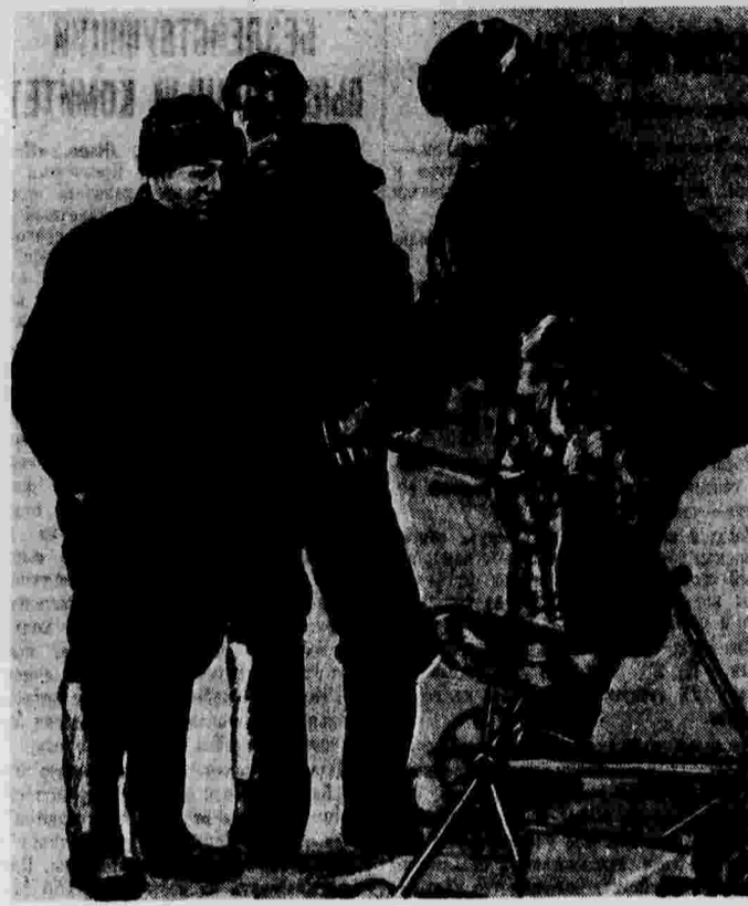
Первые дни пребывания панаминцев на Северном полюсе. На снимке: И. Д. Пананин испытывает ножной привод динамомашин. В центре — Э. Т. Кренкель. Рядом — бортмеханик самолета Алексея Тихонова. Шаманди.

В новом детском календаре, вышедшем в нынешнем году Союздетком, нет уже и следов «политической» и «санитарной» поэзии. Вместо нее календарь дает стихи Пушкина, Лермонтова, Тютчева, Некрасова и современных поэтов. Темы календаря стали гораздо разнообразнее. Школьники-модельист найдут в нем для себя схему и чертеж самолета. Юный натуралист узнает, чем кормить рыб в аквариуме и как устроить лужайку для птиц.