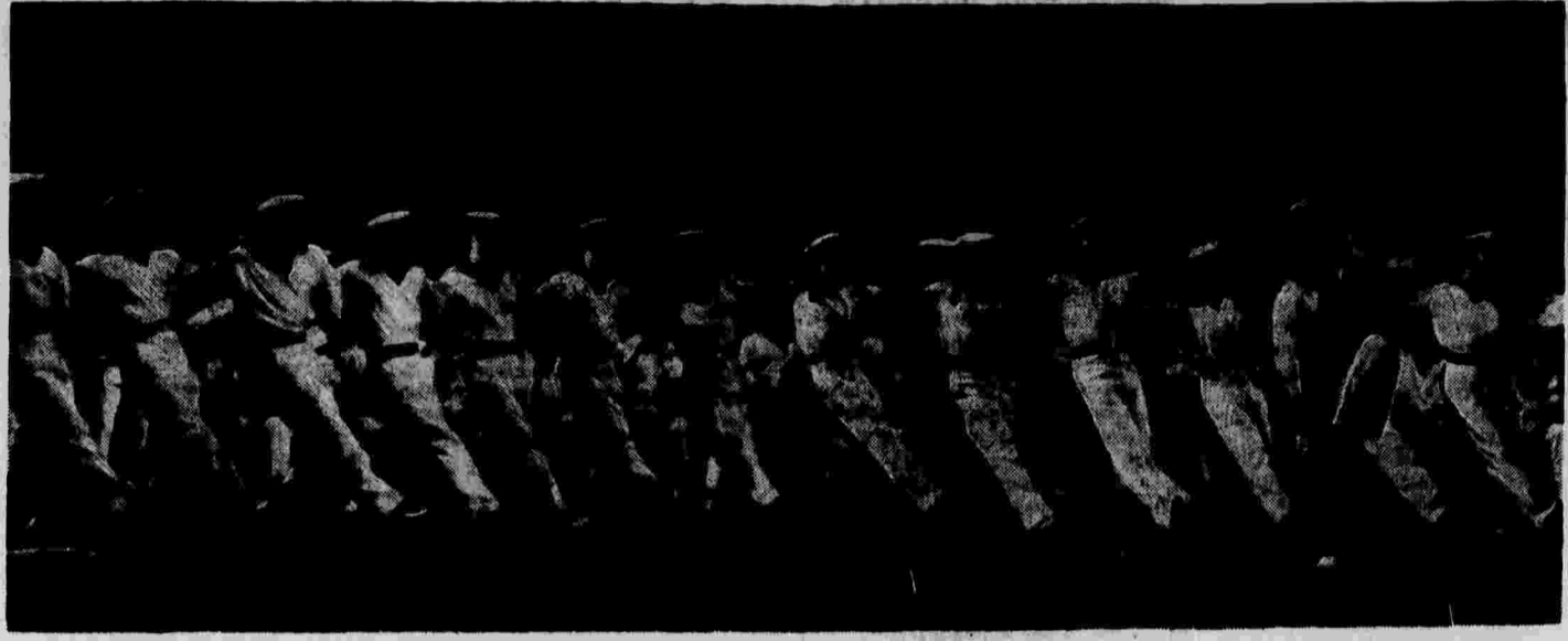
Выступление ансамбля песни и пляски Краснознаменного Балтийского флота на концерте, посвященном 20-летию Рабоче-Крестьянской Красной Армии и Военно-Морского флота, в Большом театре СССР.

24 февраля на железных дорогах Союза погрузлено 78 000 вагонов — 92,3 проц. плана, выгружено 78 184 вагонов — 92,6 проц. плана.