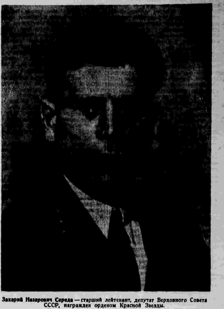
Захарий Назарович Середя — старший лейтенант, депутат Верховного Совета СССР, награжден орденом Красной Звезды.

На глазах всего ядра Англии возникло порождение от политики сотрудничества с политикой кампаниями, которая проводится под часовой критикой».