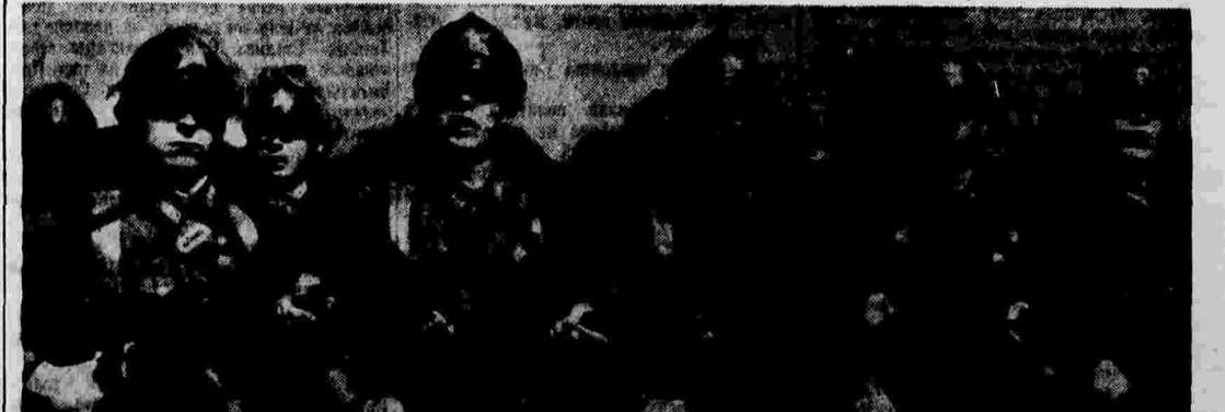
БОИЦЫ МОСКОВСКОЙ ПРОЛЕТАРСКОЙ ДИВІЗИИ.

Народный Комиссар Военно-Морского флота СССР армийский комиссар I ранга П. СМІРНОВ.