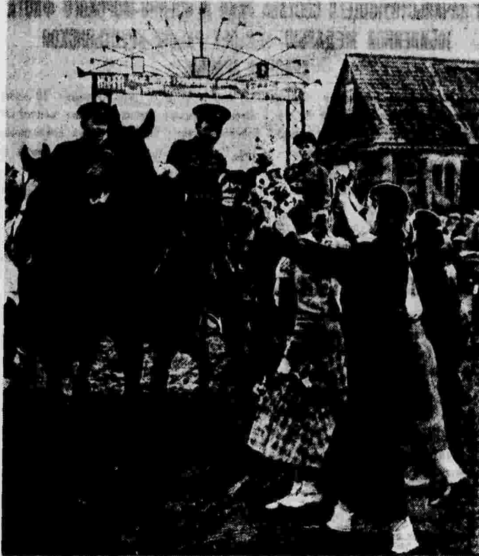
Колхозники села Дукура (Белорусская ССР) встречают с цветами части Красной Армии, направляющиеся на тактические учения.

«Помни, Ваня, все, что у нас есть, нам дали советская власть, коммунистическая партия и наш родной отец товарищ Сталин. Была развлекшая хата, построили нам школу. Шпенцыки — полные заработка. Человека у нас уважают, пенят, выдвигают. Береги, Ваня, нашу народную власть, отставая границы, не пускай