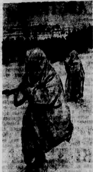
Военно-тактическая игра в Центральном парке культуры и отдыха имени Горького (Москва). На снимке: «красные» в маскировочных халатах идут в атаку.