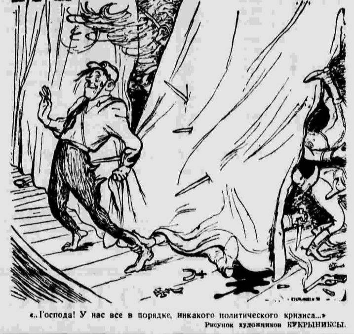
«Господа! У нас все в порядке, никакого политического кризиса...» Рисунок художников КУКРУЛИНСКИХ.