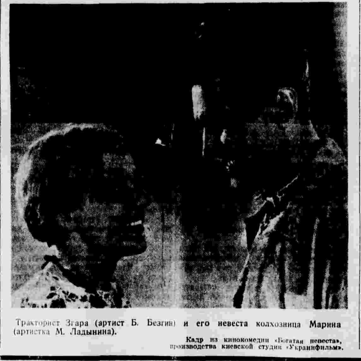
Тракторист Згара (актер Б. Безгин) и его невеста колхозница Марина (артистка М. Ладьяникова).