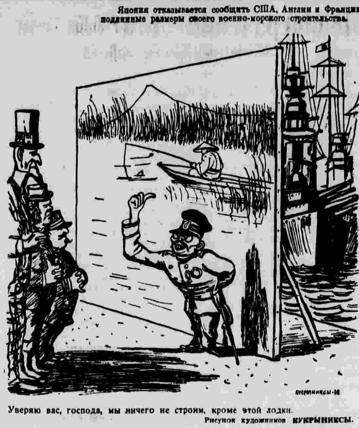
Уверю вас, господа, мы ничего не строим, кроме этой лодки. Рисунок художников МУКРЫНСКИХ.

ПАРИЖ, 9 февраля. (ТАСС). Предстоящие англо-итальянские переговоры вызывают в части французских политических кругов довольно pessimистическую оценку. Табуи пишет в «Эвр», что Муссолини своими переговорами с английскими правительством стремится сразу убить двух зайцев — получить английские кредиты и в то же время добиться признания прав воюющей стороны за генералом Франко. «Новиднику», — пишет Табуи, — часть движущих причин, которые толкают Муссолини на переговоры с Лондоном, стала понятна, по крайней мере, для английского министерства иностранных дел. Италия весьма сильно истощена в экономическом и финансовом отношении. Завоевание Абиссинии с каждым днем становится все более признанным. Необходимо получить деньги любой ценой и добиться признания итальянских завоеваний в Абиссинии». Касаясь вопроса о перспективах переговоров по поводу итальянской интервенции в Испании, Табуи пишет: «Если бы Италия действительно отозвала 75 проц. своих войск из Испании, Англия была бы расположена признать право воюющей стороны за Франко и даже признать итальянские завоевания в Абиссинии, а также предоставить Италию кредиты». Габриэль Перри пишет в «Юманите»: «Ничто не дает повода утверждать, что Италия склонна отозвать свои войска из Испании и намерена отказаться от нового наступления. Возможно, что в обмен на признание захвата Абиссинии и на предоставление займа Муссолини пообещает что-нибудь. Но ни одна итальянская солдат не будет отозван с Пиренейского полуострова».