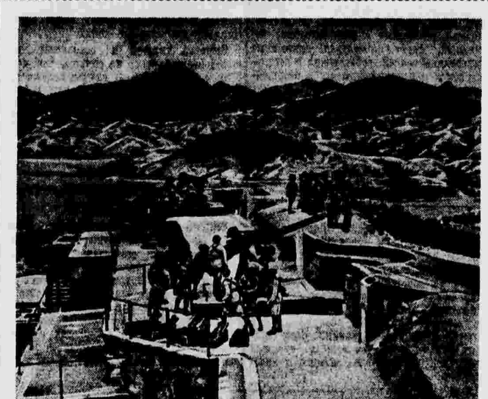
Зенитная батарея, охраняющая Гонконгскую гавань.

Рабочие принимают самое активное участие в создании оборонной промышленности. 200 шанхайских фабрик были переданы во внутренние районы страны. Перевозка оборудования этих фабрик производилась рабочими, которые относятся к этому делу с огромным энтузиазмом и бережливостью. Не было ни одного случая поломки перевозочных машин.