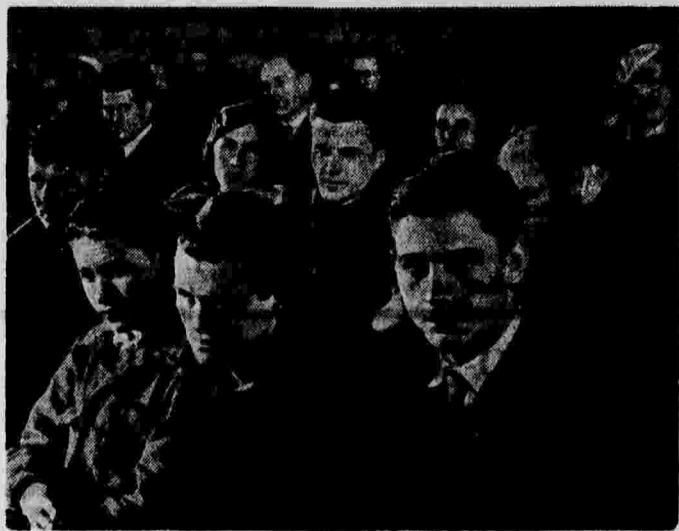
На собрании стахановцев-выдвиженцев завода «Шарикоподшипник» имени Л. М. Кагановича (г. Москва).