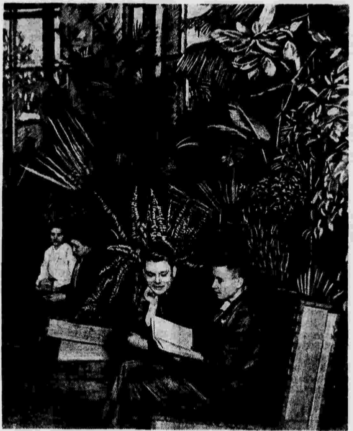
Во Дворце культуры Автозавода им. Сталина (Москва).