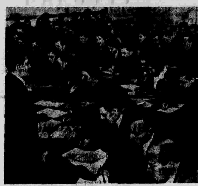
Курсы руководителей первичных партийных организаций Молотовского райкома ВКП(б) в Москве. Лекция по истории СССР.