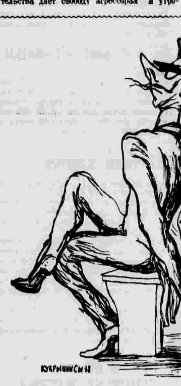
Независимое польско-перуанское воздержание от голосования. Рисунок художника Курьянски.

Компартия создает во многих городах Швейцарии митинги протеста против политики швейцарского правительства, льющей воду на мельницу фашистских агрессоров.