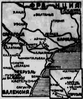
от Эль Мулетон был успешно отбит республиканцами.

ВОСТОЧНЫЙ (САРАГОССКИЙ) ФРОНТ 28 января в турульском секторе в районах Сигры и Оладе продолжался бой.