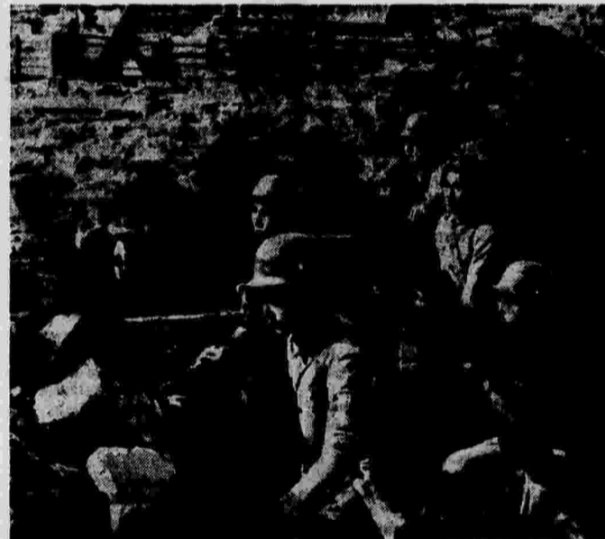
Военные действия в Китае. На снимке: пулеметчики китайской армии.

Всю ночь на 29 января продолжались серьезные бои в секторе Сигра, к северозападу от Теруаля.