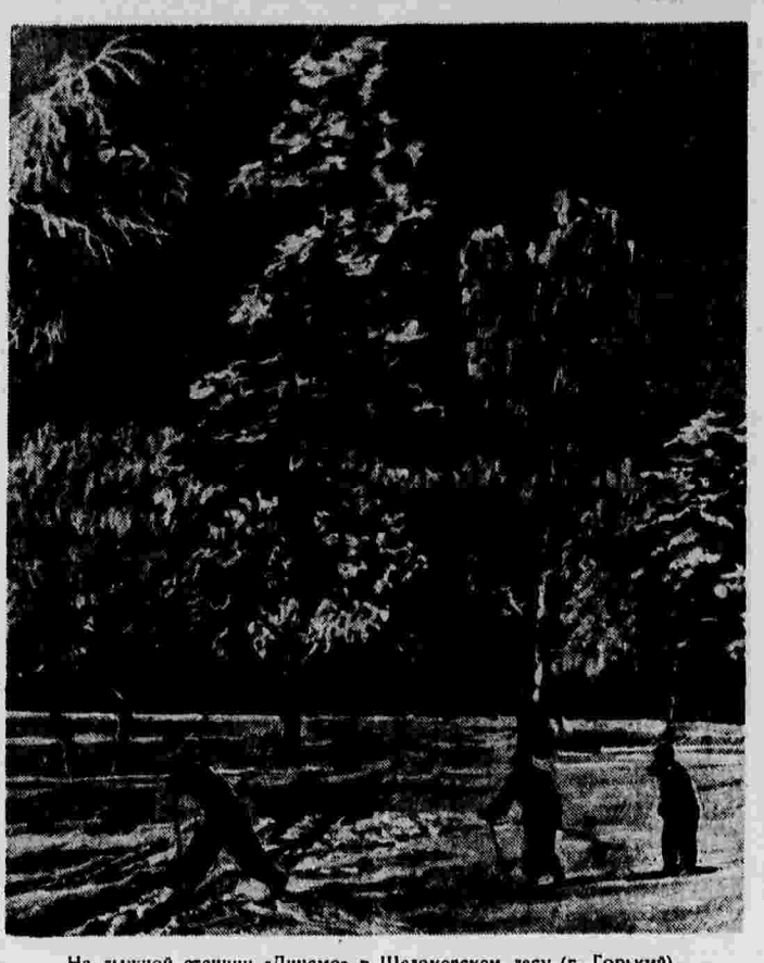
На лыжной станции «Динамо» в Шелоковском лесу (г. Горький).

СЕВАСТОПОЛЬ, 29 января. (Корр. «Правды»). Изобретатели и рационализаторы Черноморского флота выносят сотни ценных предложений в пользу КХУ госучреждения Красной Армии и Военно-Морского флота. Военный инженер первого ранга Попов сконструировал прибор для очистки контактов моторных свечей.