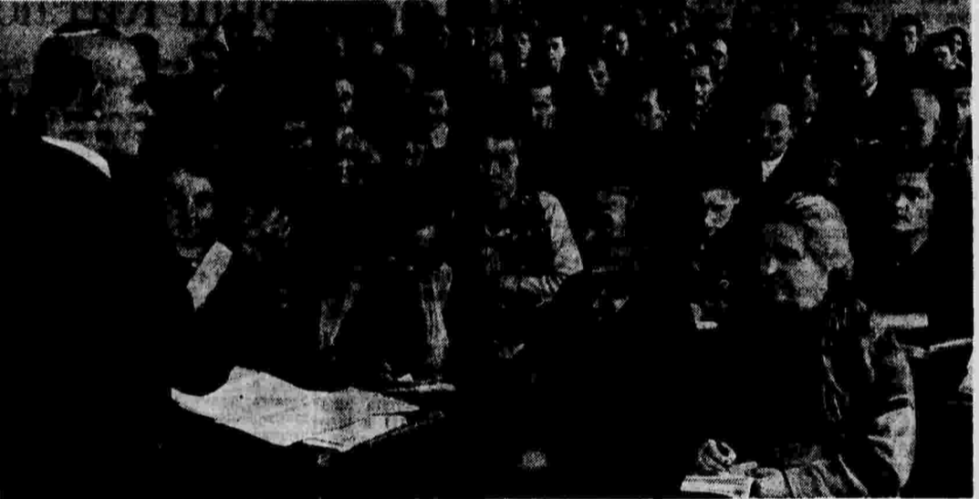
Агитаторы Сокольнического района (Москва) слушают инструктивный доклад по антирелигиозной пропаганде.

СВЕРДЛОВСК, 29 января. (Морр. «Правда»). Горком обсудил вопрос о преподавании истории партии в учебных заведениях Свердловска. Выяснилось, что учебные заведения города лишь наполовину обеспечены преподавателями по истории партии и что многие из преподающих этот предмет не обладают специальной подготовкой и мало работают над повышением своих знаний. Горком постановил выделить 12 пропагандистов для подготовки их к преподавательской деятельности по истории партии в учебных заведениях города.