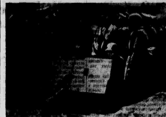
В Польшу приехала германская военная миссия инспектировать состояние польской армии. На снимке: германские генералы знакомятся с польской артиллерией в окрестностях Варшавы.

Солнечный январский день. Дорога Теруэль—Валенсиа. Суровые дни снежной бури прошли, но грузовики движутся осторожно и медленно. На этих грузовиках из Теруэла эвакуируют женщин, детей, стариков. Какие они истощенные, измученные! Ребенкишки закутаны заботливой рукой санитаров в теплые, пухлятые одеяла и шепечут, как птицы, вырвавшиеся на волю. Вдруг шофер резко тормозит машину. Он вглядывается в прозрачную снегу неба и зовет проходящих пешеходов на помощь. Те же бегут к машине, хватают застывших детей, несутся с ними прыжками в снежное поле. Прикалому винтовки один из бойцов уминая снег. Дети кладут на куртки, обмороженные пехотинцы. Вот бежит с коромыслом санитар — в руках у него белый полотноный венок. Мгновение — и дети накрыты простыней; сверху ничего не видно, поле попрежнему чисто, белое. Тут, люди на дороге слышат только биение своего сердца. Они невольно припадают к бортовым грузовикам, за грузовиком, в дорожной канаве. Вдруг в тиньне раздается сухая дрожь пулеметной очереди. Одна из женщин на грузовике приподнялась и снова упала, зовя угасающим взором уносимую тень фашистского истребителя, совершившего свое страшное, кровавое дело. Шека женщины прострелена пулей. Ее лицо темнеет, становится синим. Губы умирающей шепелят в последний раз. Она показывает рукой на снежное поле, где спрятались ее ребята. Напомнившая в ней пехотинца И-свето батальон слышит последние слова умирающей: «Тереса! Тереса! Жива! Спаси!».