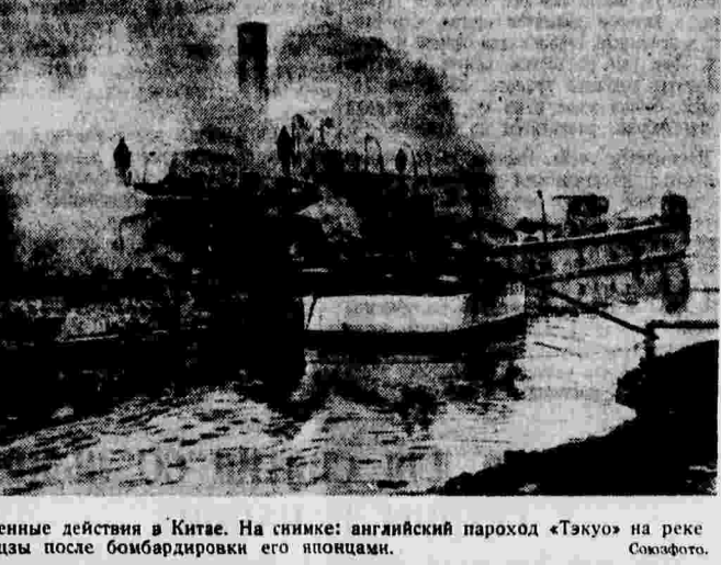
Военные действия в Китае. На снимке: английский пароход «Тэку» на реке Янцзы после бомбардировки его японцами.