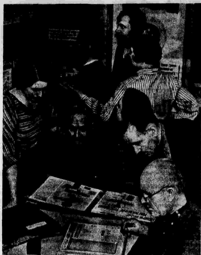
В Доме партийного просвещения Бауманского района (Москва) организатор уголок советского строительства. Агитаторы района знакомятся с работой уголка.