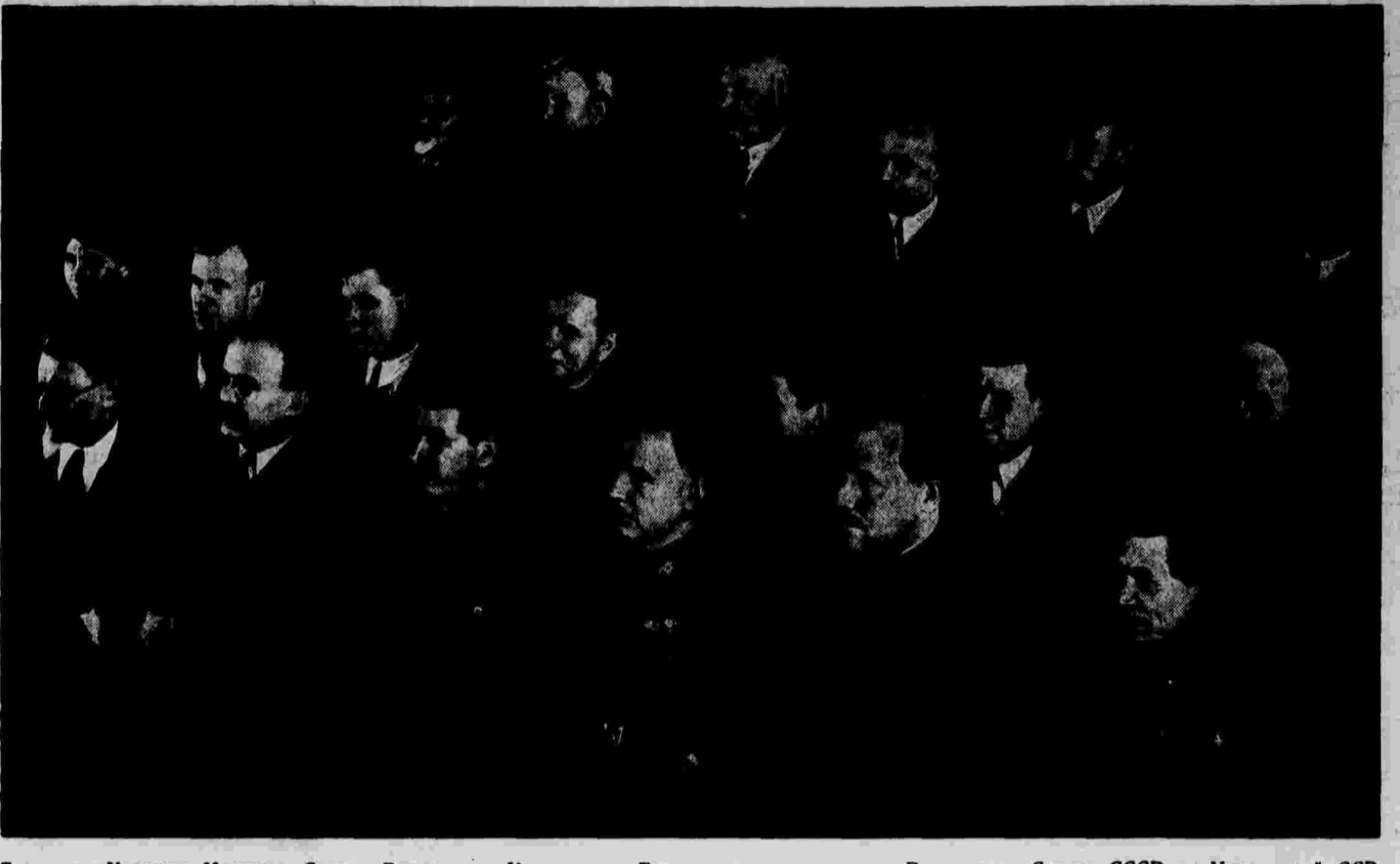
Товарищи Калинин, Молотов, Сталин, Ворошилов, Каганович и Ежов в группе депутатов Верховного Совета СССР от Украинской ССР.

нашел ничего лучшего, как ограничить для станции Омск прием поездов и разрешить начальнику этой станции отправлять поезда по мере готовности составов. Таким образом, своей собственной рукой этот горе-руководитель узаконил нарушение графика. Вот пример возмутительной недисциплинированности!