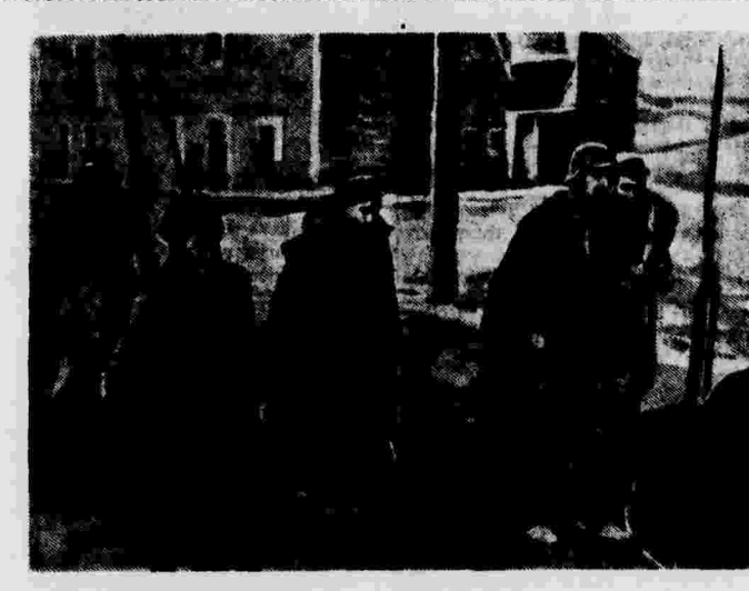
Пленные фашисты, захваченные республиканскими войсками в Теруэле.

В Австралии завладела торговое соглашение с «правительством» Франко.