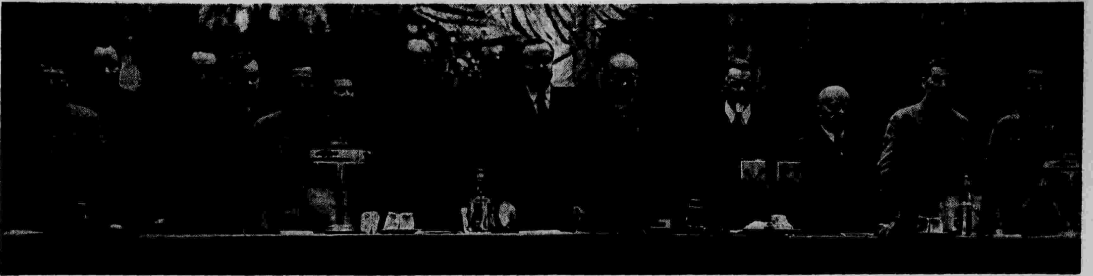
21 января 1938 года в Государственном Академическом ордена Ленина Большом театре Союза ССР. В президиуме торжественно-траурного заседания, посвященного XIV годовщине со дня смерти В. И. Ленина (слева направо), — товарищи Жданов, Димитров, Микоян, Булганин, Андреев, Ежов, Каганович, Молотов, Хрущев, Калинин, Косиор, Сталин и Ворошилов.

ОБЗОР ИНОСТРАННОЙ ПЕЧАТИ: Критическое положение итальянских финансов (5 стр.). Военные действия в Китае (5 стр.). Патриотизм китайских народных масс (5 стр.). На фронтах в Испании (5 стр.). Долорес Ибаррури — Испания будет свободной! (5 стр.). Новая калийная база Советского Союза (6 стр.).