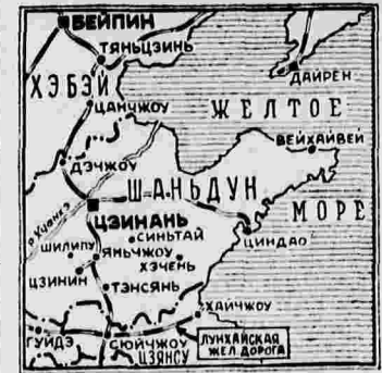
Крупные бои происходят также на левом фланге, в районе Шилуну (к северо-западу от Цзинни).

По дополнительным данным, подробности занятия китайскими войсками Цзинни вырисовываются в следующем виде: после падения Цзинни китайские войска отошли на другой берег реки Юньхэ. В ночь на 12 января, получив подкрепления, китайские части перешли реку по льду и стремительным ударом напали на город. Не выдержав этого натиска, японские войска отступили.