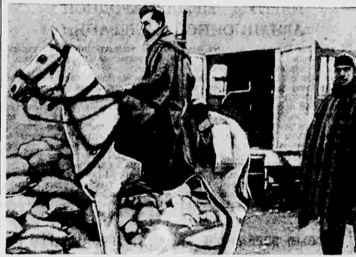
Боец-кавалерист республиканской армии Испании под Теруэлем.

На стороне же миттежиров — 150 тысяч итальянцев, 20 тысяч германцев, 15 тысяч легионеров, 50 или 60 тысяч африканцев. Таким образом, половина фашистских войск состоит из иностранных наемников. Кроме того, в войсках миттежиров имеется 150 тысяч наемных мобилизованных солдат, верность которых весьма сомнительна».