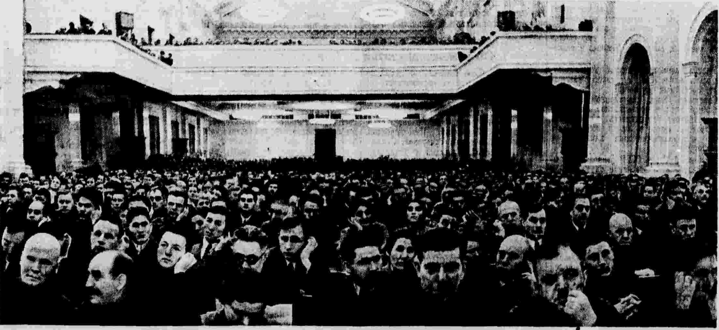
Общий вид зала совместного заседания. Совета Союза и Совета Национальностей 15 января 1938 года.

Вот те изменения и дополнения к некоторым статьям Конституции СССР, которые представляются на утверждение Верховного Совета Союза Советских Социалистических Республик. (Аплодисменты).