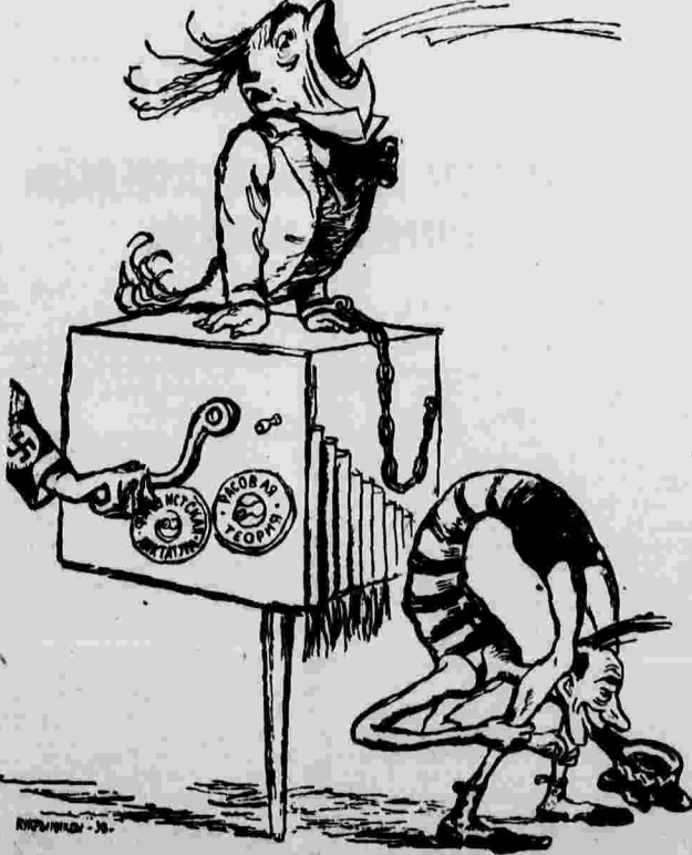
Румыно-польский аттракцион под берлинскую шарманку. Рисунок художника Кузнецова.

Я говорил с рабочими одного ближайшего рудника, они тоже жаловались на низкую зарплату. Получая в неделю 24 марки, они должны платить за жилье 25 марок в месяц. Ожидая рабочих в Германии делается во всяких суррогатов, и тем не менее она очень дорога. И не смог больше выдержать такой жизни в Германии».