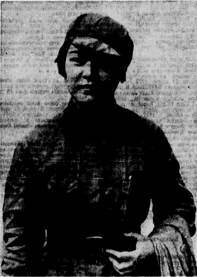
Политработница одной из частей 8-й китайской национально-революционной армии.