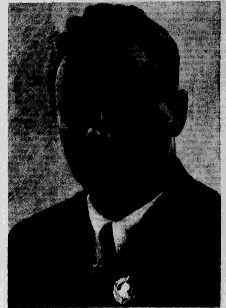
Депутат Верховного Совета СССР Василий Степанович Мусинский — стахановец, орденосец, недавно избранный заместителем председателя Архангельского областного исполнительного комитета.

ПАРИЖ, 10 января. (ТАСС). Вчера в Бизерте состоялась похоронная пани арабов, убитых во время столкновения арабских демонстрантов с французскими войсками. В связи с этим «Юманите» пишет: «Обстоятельства, при которых произошли кровавые события в Бизерте, указывают на то, что некоторые элементы стремятся травить массы тунисского населения Туниса против Франции и народного фронта».