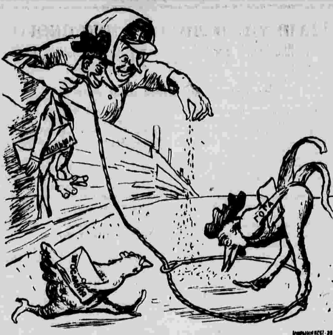
«Независимая» политика Польши и Румынии. Рисунки художников Курьяниных.

Усилилась подпольная работа гитлеровцев и в Чехословакии. Судето-немецкая партия — эта откровенная агентура гитлеровской Германии в Чехословакии — с каждым днем пред являет все большие претензии.